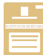
SUSTITUTO DE SECRETARIO