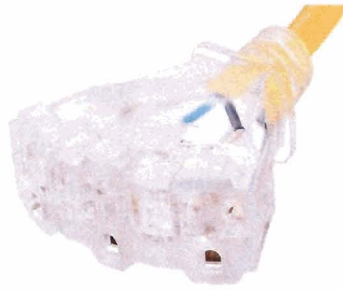
Formato de Enchufe: NEMA 5-15P