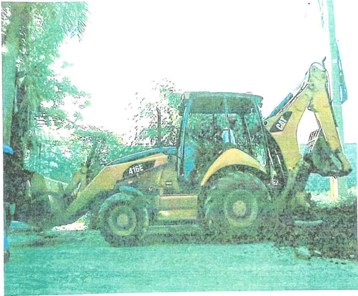
Retroexcavadora Caterpillar – Matricula U010593