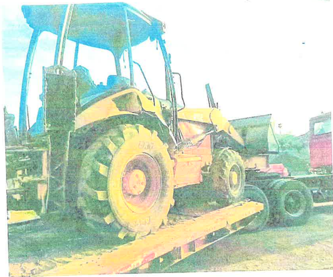
Retroexcavadora Caterpillar – Matricula U010594