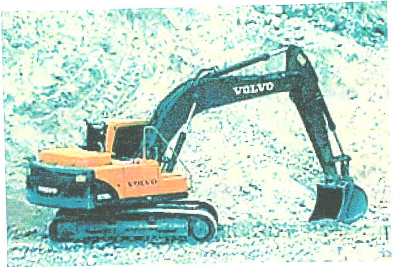
Excavadora Volvo – Matricula U006790