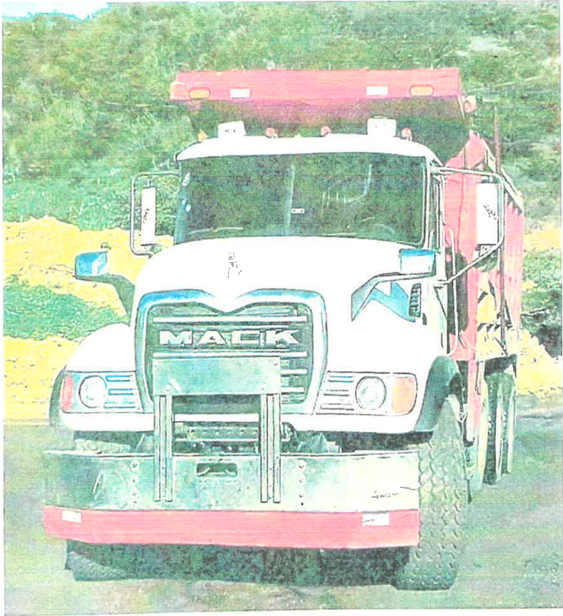
Camion Volteo Mack – Matricula S018345