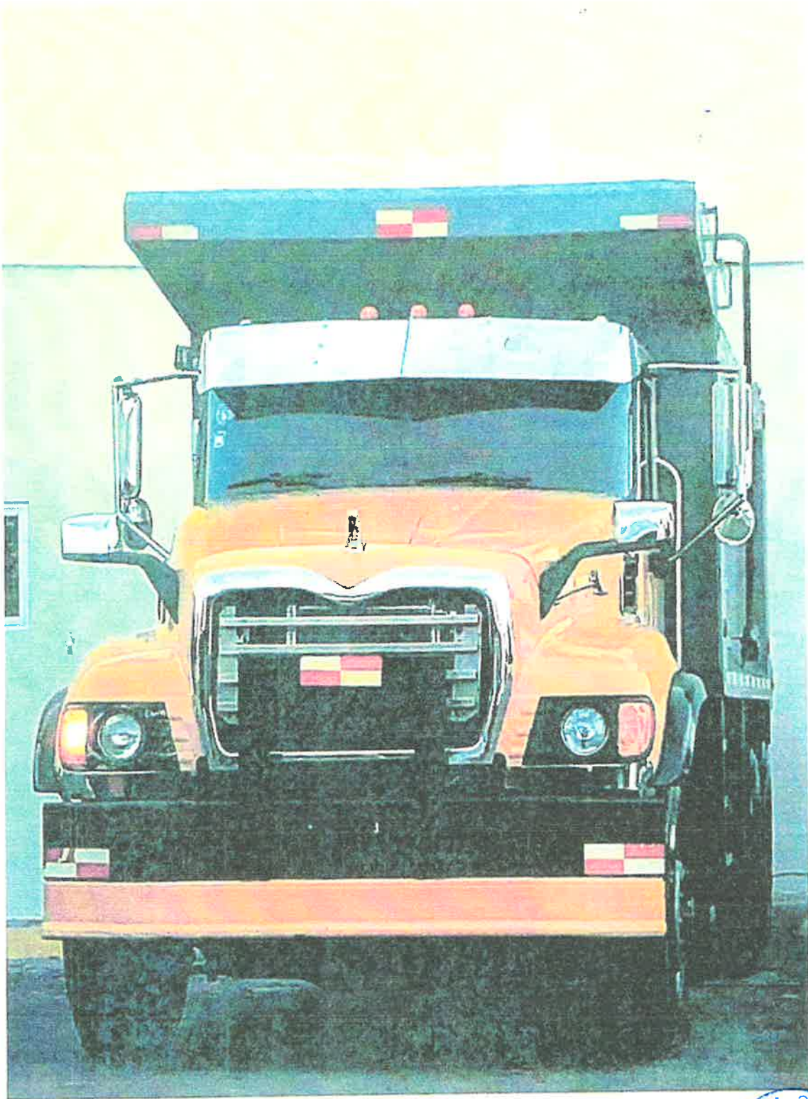
Camion Volteo Mack – Matricula S019020