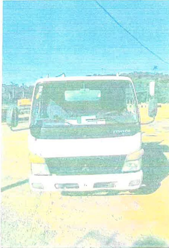
Camión Volteo Mitsubishi Fuso – Matricula U006790