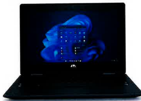
*La imagen del producto puede diferir del producto real

Empiece a trabajar directamente con la confianza de saber que el reforzado equipo HP Pro Fortis x360 lo acompañará en todo lo que haga, cómo, dónde y cuándo sea. El equipo x360 cuenta con sólidas herramientas de productividad y colaboración en línea que le ayudan a completar sus actividades diarias.