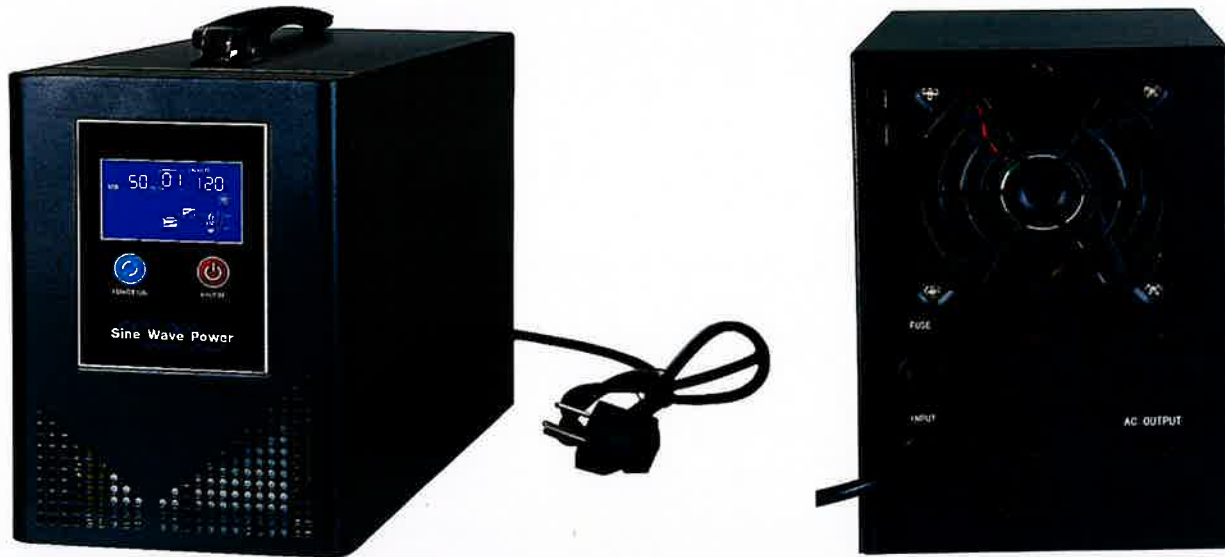
UPS Portable BES 600VA