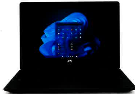
*La imagen del producto puede diferir del producto real

Empiece a trabajar directamente con la confianza de saber que el reforzado equipo HP Pro Fortis x360 lo acompañará en todo lo que haga, cómo, dónde y cuándo sea. El equipo x360 cuenta con sólidas herramientas de productividad y colaboración en línea que le ayudan a completar sus actividades diarias.