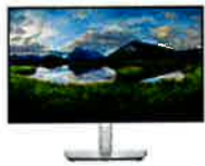
Dell 24 USB-C Hub Monitor - P2422HE

Stay productive in the classroom or lab and enjoy excellent color accuracy with this sleek 23.5" FHD monitor with ComfortView Plus.