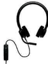
Dell Pro Stereo Headset - WH3022

Pair and connect to almost any PC via 2.4GHz wireless or Bluetooth 5.0 and enjoy a long 36 months 6 battery life.