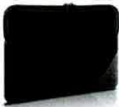
Dell Essential Sleeve - ES1320V

Enhance everyday learning with a quiet full-size keyboard and mouse combo that offers programmable shortcuts and 36 months 6 battery life.