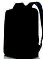
Dell Essential Backpack 15 - ES1520P

Take notes or sketch a diagram on your 2-in-1 as if you were writing with pen on paper. With up to 1,024 levels of pressure sensitivity, the pen is like a natural extension of your hand.