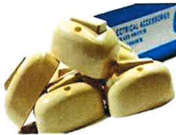
INT SENCILLO TICTAC 20029 CJA DE 200 UNIDADES