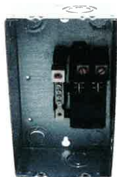
PANEL DE BREAKER DE 2 A 4 CIRCUITOS