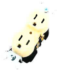
TOMAC. DOBLE (DECORATIVO) FULGORE 31465