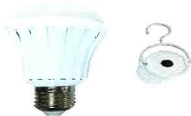
BOMBILLO LED RECARGABLE DISTINTOS WATTS 20412