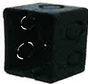
CAJA RECTANGULAR 2X4 DE ½ USA