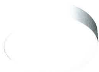
LAMPARA LED DE DISTINTAS MEDIDAS