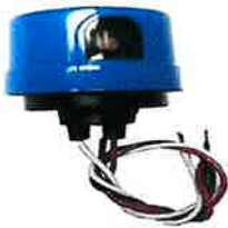
FOTOCELDA 140001 CJA DE 100 UNID