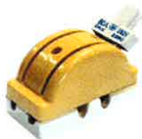
DOBLE TIRO DE 60 AMP 2P JAPONES