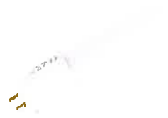
TUBO DE LED DE 18 W