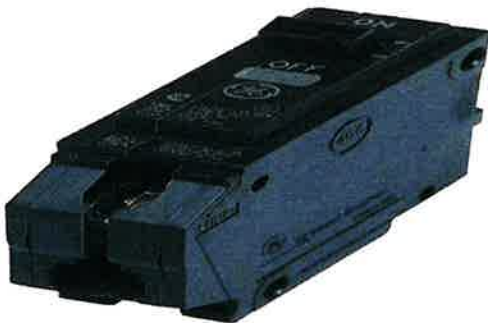
BREAKER AMPERES GRUESO (DISTINTOS AMPERES) 20200