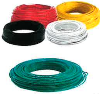
ALAMBRE STANDARD # 6,8 y 12 DE 500 PIES