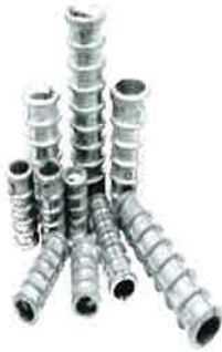
TARUGO DE PLOMO DIFERENTES (MEDIDAS) 5/16 X 1/2X 1 ½ 10973