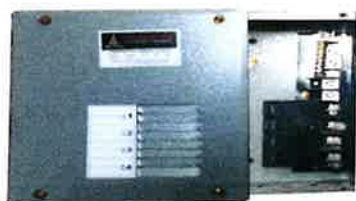
PANEL DE BREAKER DE 4 A 8 CIRCUITOS