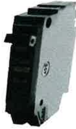
BREAKER FINO (DISTINTOS AMPERES) 20197