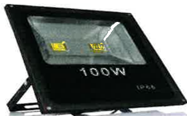
LAMPARA REFLEXTIVA LED DISTINTOS # 50-100 Y 150 WATTS 11429