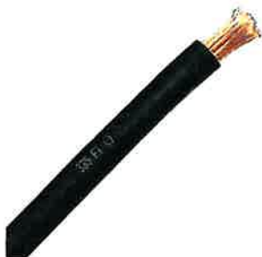
ALAMBRE MULTIFIBRA PARA SOLDAR DIFERENTES MEDIDAS