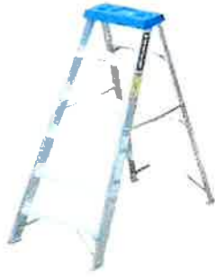
ESCALERA DE ALUMINIO DIFERENTES MEDIDAS # 6 Y 8