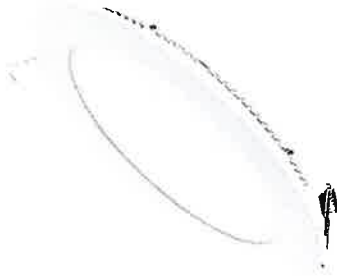
LAMPARA LED DISTINTOS WATTS 11439