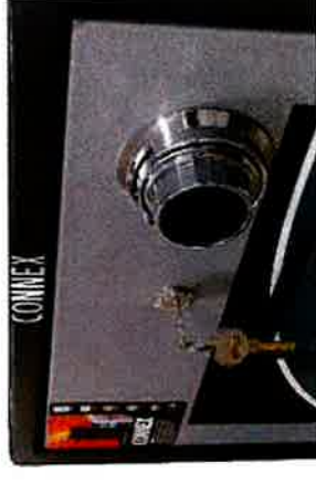
Detalle de llave y combinación manual

ARCHIVO EN METAL 4 GAVETAS ANTIFUEGO MARCA CONNEX