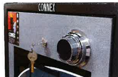
Detalle de llave y combinacion manual