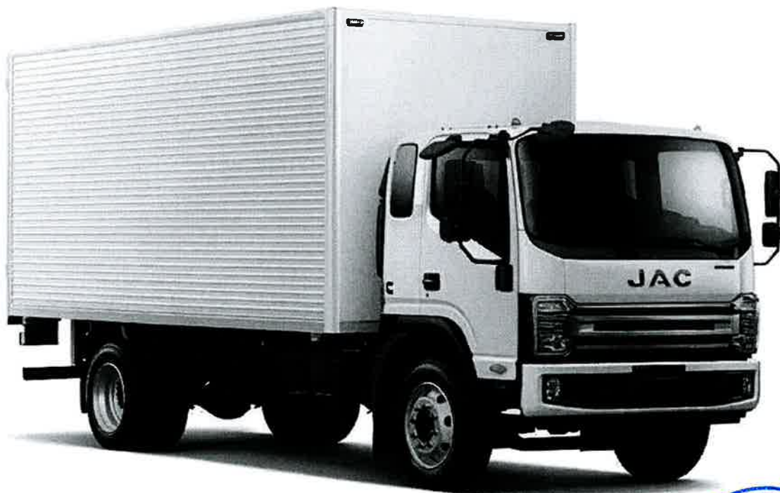
CAMIÓN JAC N120 CON FURGON HFC1120KN

Atendiendo a su solicitud, tenemos el placer de someter a su consideración nuestra propuesta de ventas que se describe a continuación: