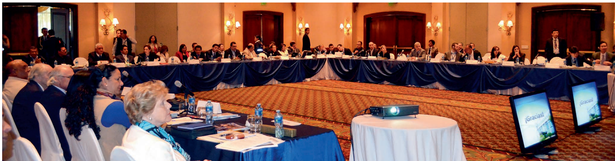
El encuentro de UNIORE reunió a expertos electorales de América y Asia.