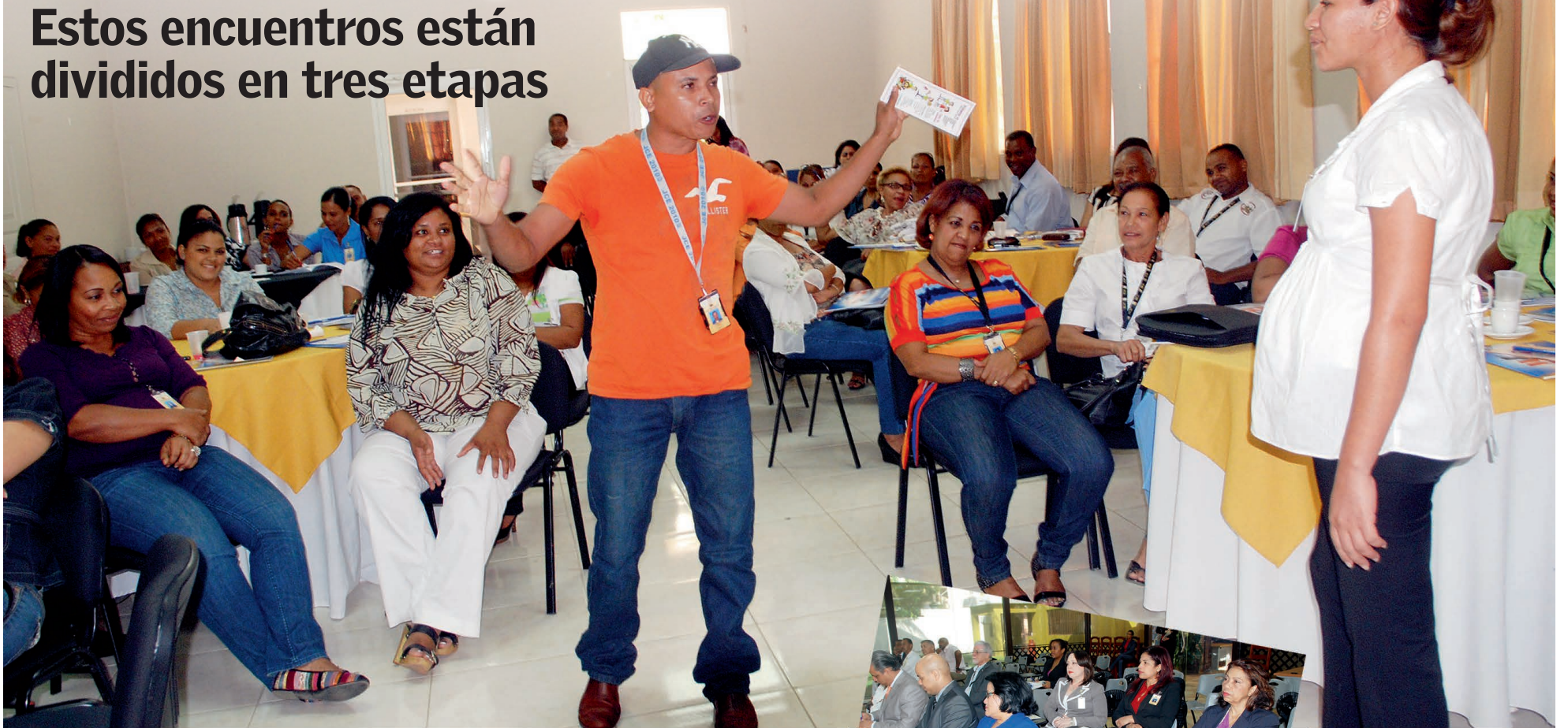
Los participantes dramatizan un acto de violencia de género.

Estos encuentros están divididos en tres etapas