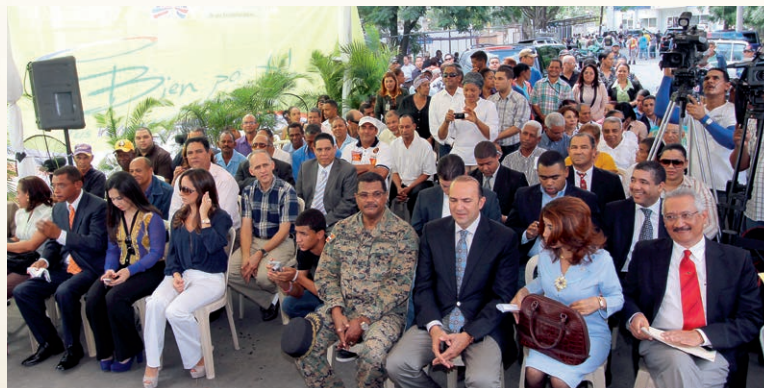
Parte del público que asistió al acto.

Este esfuerzo de la JCE, del Gabinete Social de la Presidencia y del Banco Mundial dio lugar a que ésta institución financiera destinara US$5,580,000.00 para la Unidad de Declaraciones Tardías, adquisición de equipos y tecnología para el establecimiento.