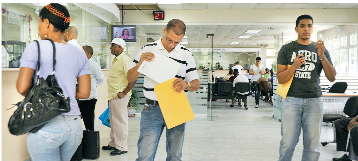
La JCE ha llevado sus servicios a todo el país.

El Presidente de la Junta Central Electoral dijo asimismo que se ha dispuesto de un fondo especial de unos 30 millones de pesos para atender las necesidades básicas de las Oficialías del Estado Civil, los Centros de Cedulación y los Centros de Servicios, a fin de que puedan mejorar los servicios que