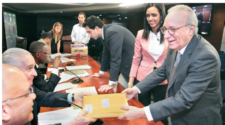
El proceso de licitación atrajo a 18 empresas nacionales e internacionales.