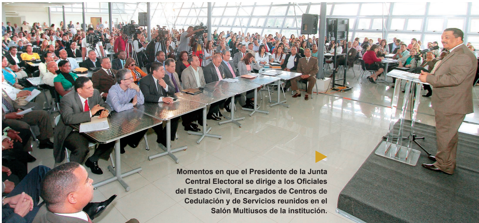
Momentos en que el Presidente de la Junta Central Electoral se dirige a los Oficiales del Estado Civil, Encargados de Centros de Cedulación y de Servicios reunidos en el Salón Multiusos de la institución.