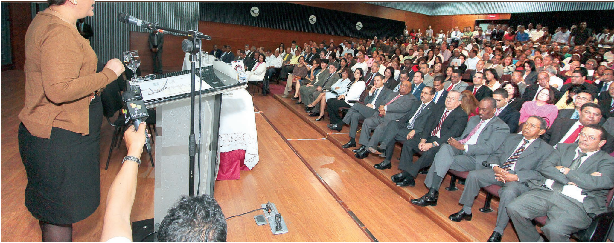
La doctora Tibisay Lucena Ramírez, Presidenta del CNE de la República Bolivariana de Venezuela, al pronunciar la conferencia sobre el Poder Electoral en su país. Se observa además parte de