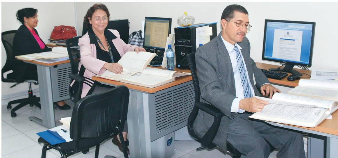
La Unidad trabaja intensamente en estos casos.

La primera indagatoria de la Unidad de Auditoría e Investigación de Libros Registros del Estado Civil de la Comisión de Oficialías, que se encuentra en formación, ha detectado irregularidades en aproximadamente 1,000 folios en su mayoría pertenecientes a libros-registros segundos originales, con motivo de una red mafiosa que operó hasta hace dos años en la Oficina Central de del Estado Civil, en el Centro de Los Héroes, cuyos cabecillas fueron detenidos y sometidos a la acción de la Justicia.