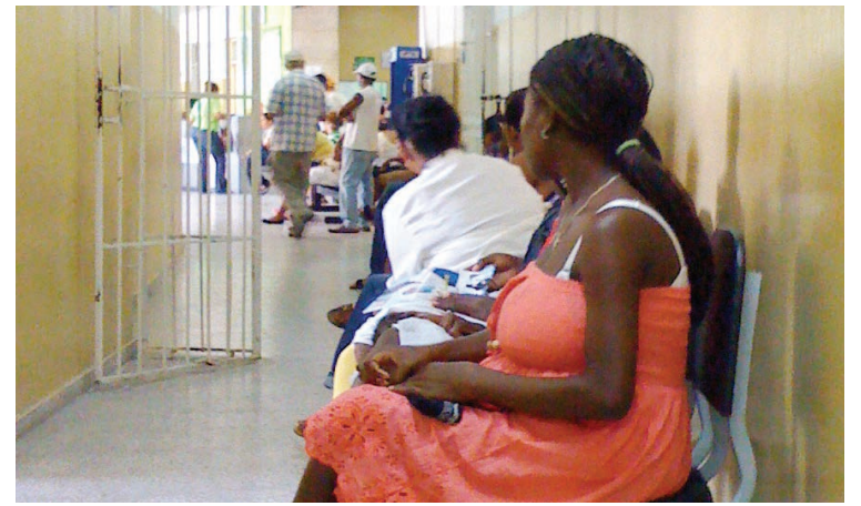
Con frecuencia a los hospitales dominicanos se presentan ciudadanas haitianas en labores de parto sin ninguna documentación.