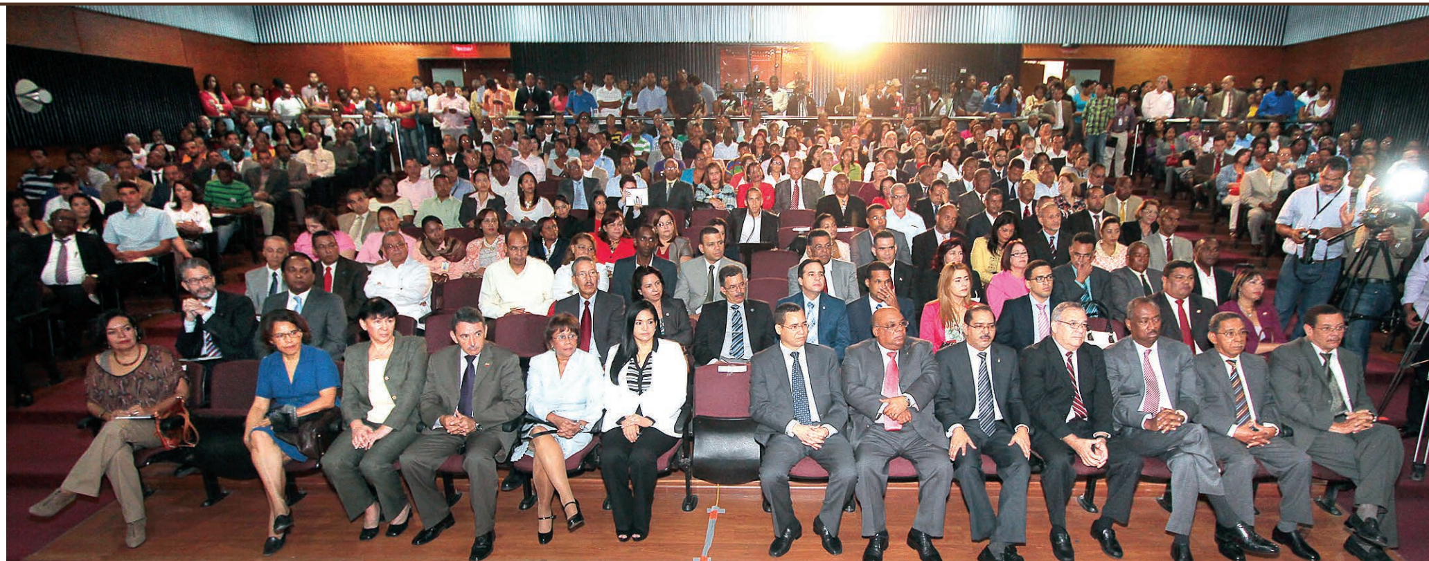
los asistentes en el Parainfo de la Facultad de Ciencias Económicas y Sociales de la UASD.