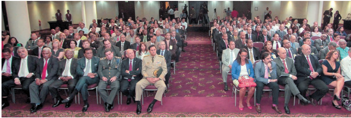
Parte del Público que asistió al acto inaugural.

A la actividad asistieron representantes de todos los parti-