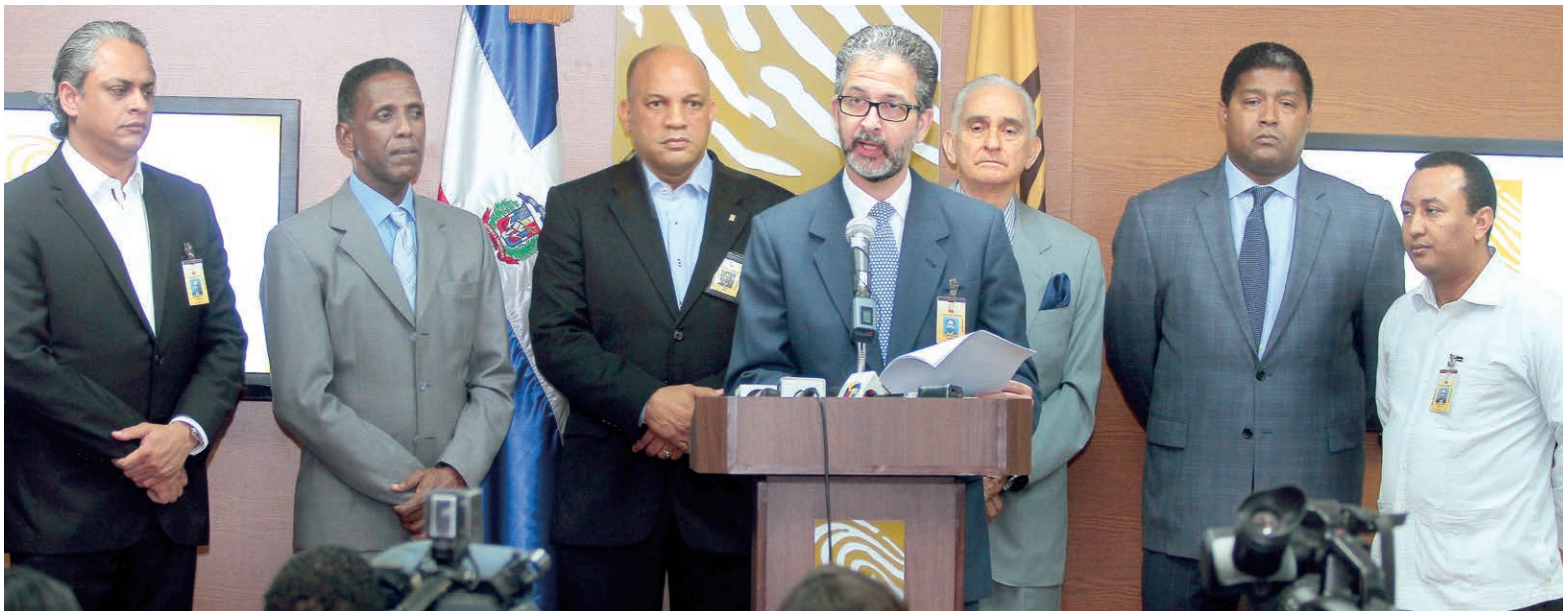
La Comisión de Compras y Licitaciones y el secretario general de la JCE Ramón Hilario Espiñeira, durante una de las ruedas de prensa relativa al proceso de licitación de la nueva cédula.