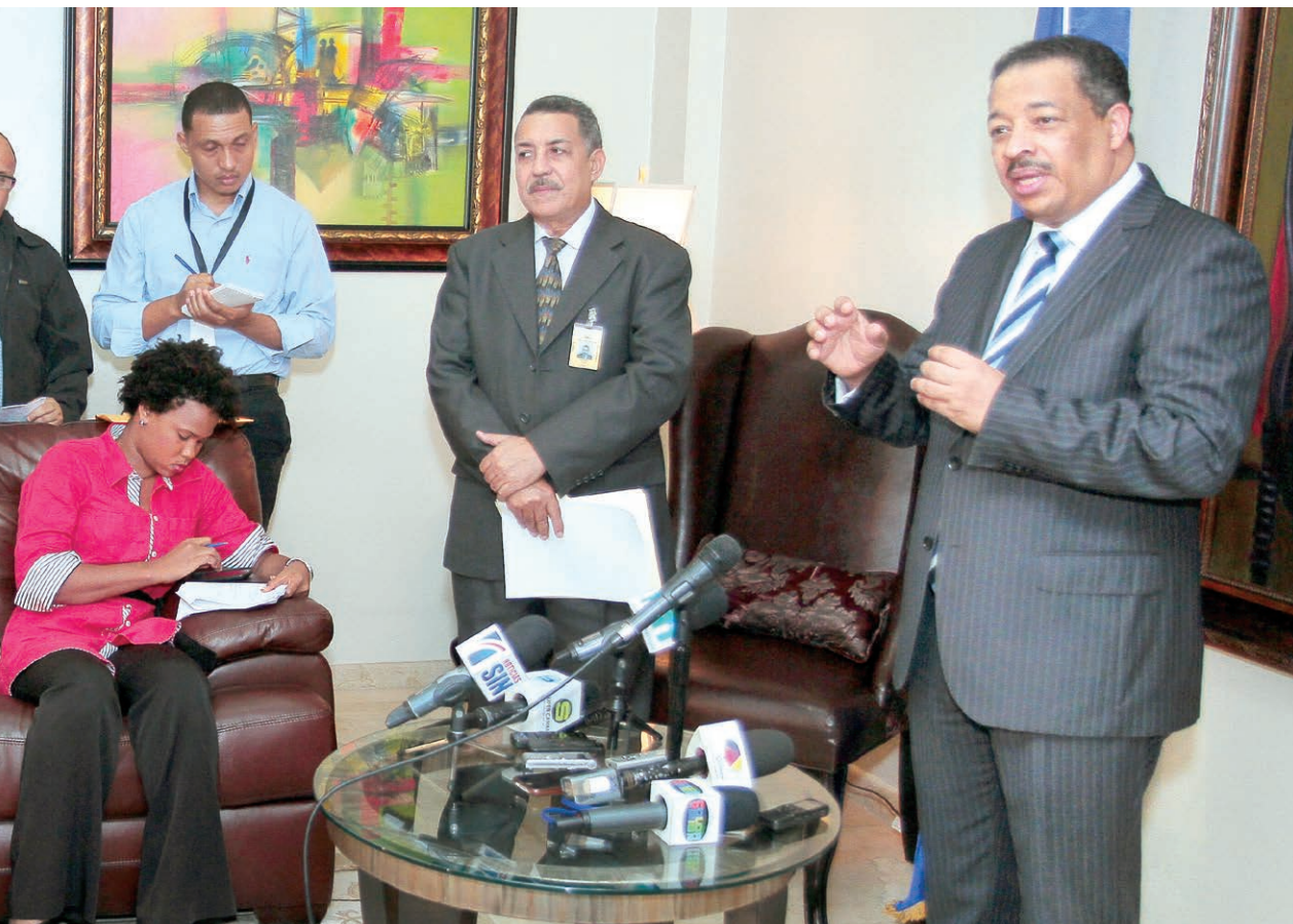
El presidente de la Junta Central Electoral, doctor Roberto Rosario Márquez al momento de informar los resultados del Pleno.

punta para la realización del escrutinio, esto significa la sustitución del conteo manual por un conteo automatizado que incluye el conteo de los votos, la redacción e impresión del acta y la transmisión de los resultados, superando las situaciones traumáticas que generan las distorsiones y descuadres de actas que tanto afectan la transparencia de los procesos y tantos dolores de cabezas han creado en la administración de procesos electorales pasados. la automa-