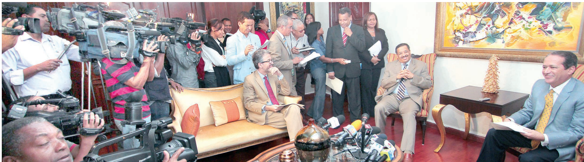
El encuentro entre el presidente de la Junta Central Electoral, doctor Roberto Rosario Márquez y el presidente del Senado, doctor Reinaldo Pared Pérez, se desarrolló de manera cordial.