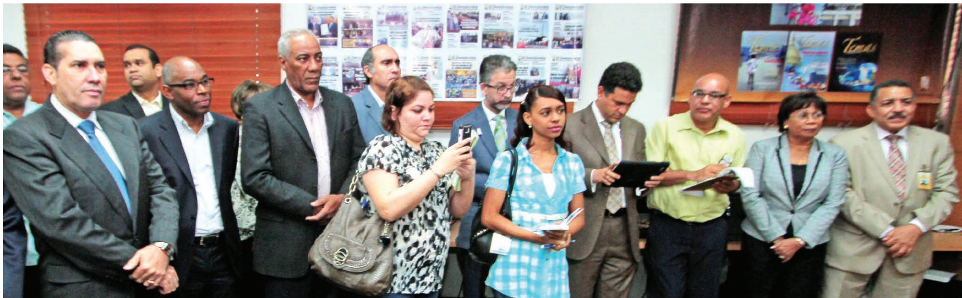
A la puesta en circulación de la IV Edición de la Revista Tema de Democracia de la Junta Central Electoral (JCE) asistieron escritores y colaboradores de la revista, personalidades de los partidos políticos, directores de medios de comunicación, creadores de opinión pública, magistrados y funcionarios de la JCE y representantes de los medios de prensa.