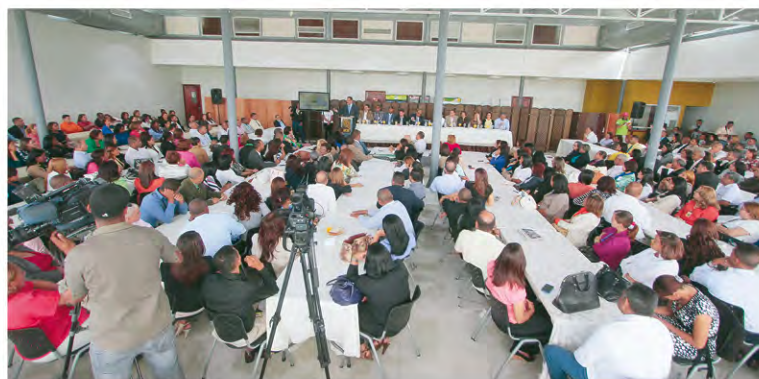
Encuentro realizado en la Sede central.