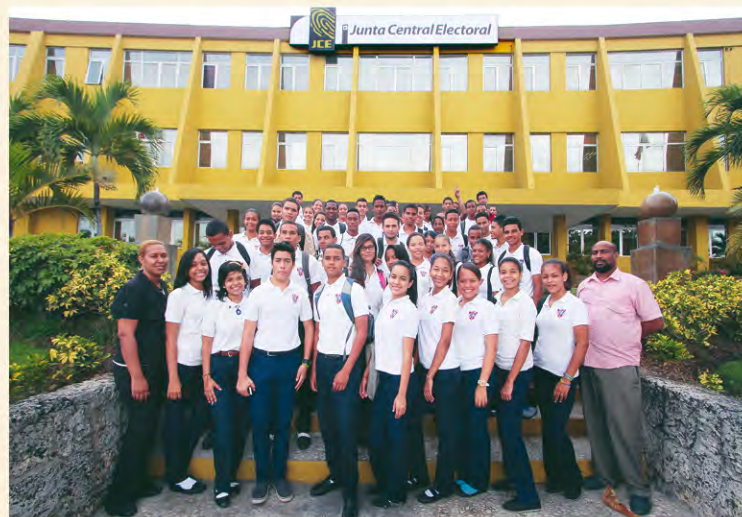
Los jóvenes del Colegio Evangélico Central posan frente al edificio principal de la JCE.

En su visita los jóvenes se interesan en el funcionamiento de la JCE, recorren los departamentos de cedulaación, informática, registro civil y participan en un programa de preguntas y respuestas en el auditorio central de la Institución.