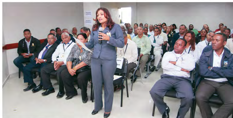
En Barahona el personal de la JCE llegó temprano a la cita.