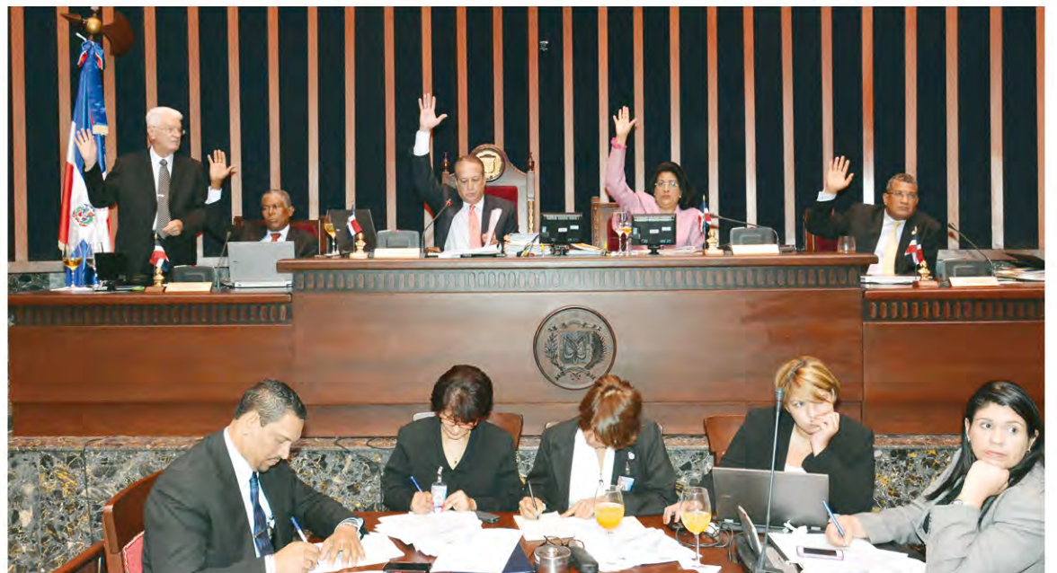
Se destaca el gran interés exhibido por los legisladores de ambas cámaras que aprobaron de manera records la propuesta del Poder Ejecutivo.