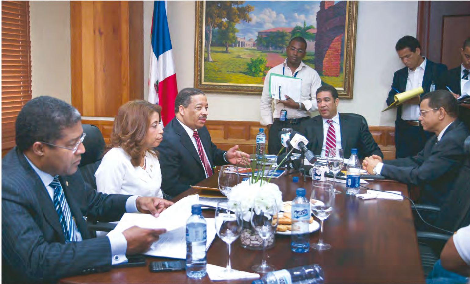
La reunión fue considerada muy importante por los participantes.