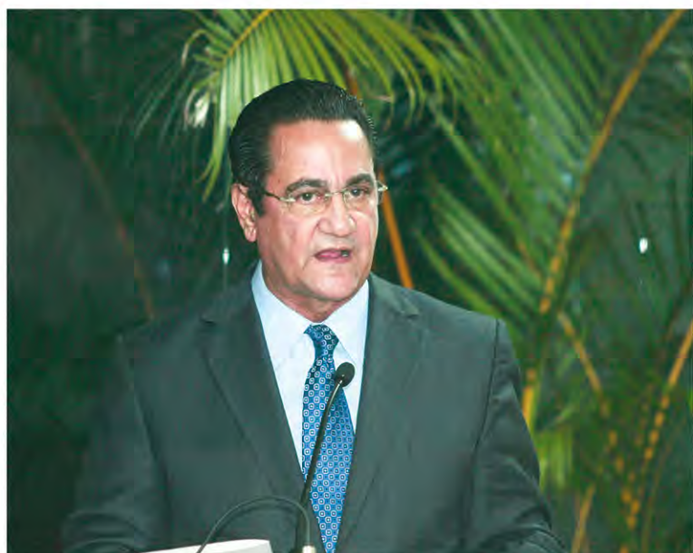
El rector de la UASD, doctor Iván Grullón, destacó el compromiso de la UASD con la nación dominicana.