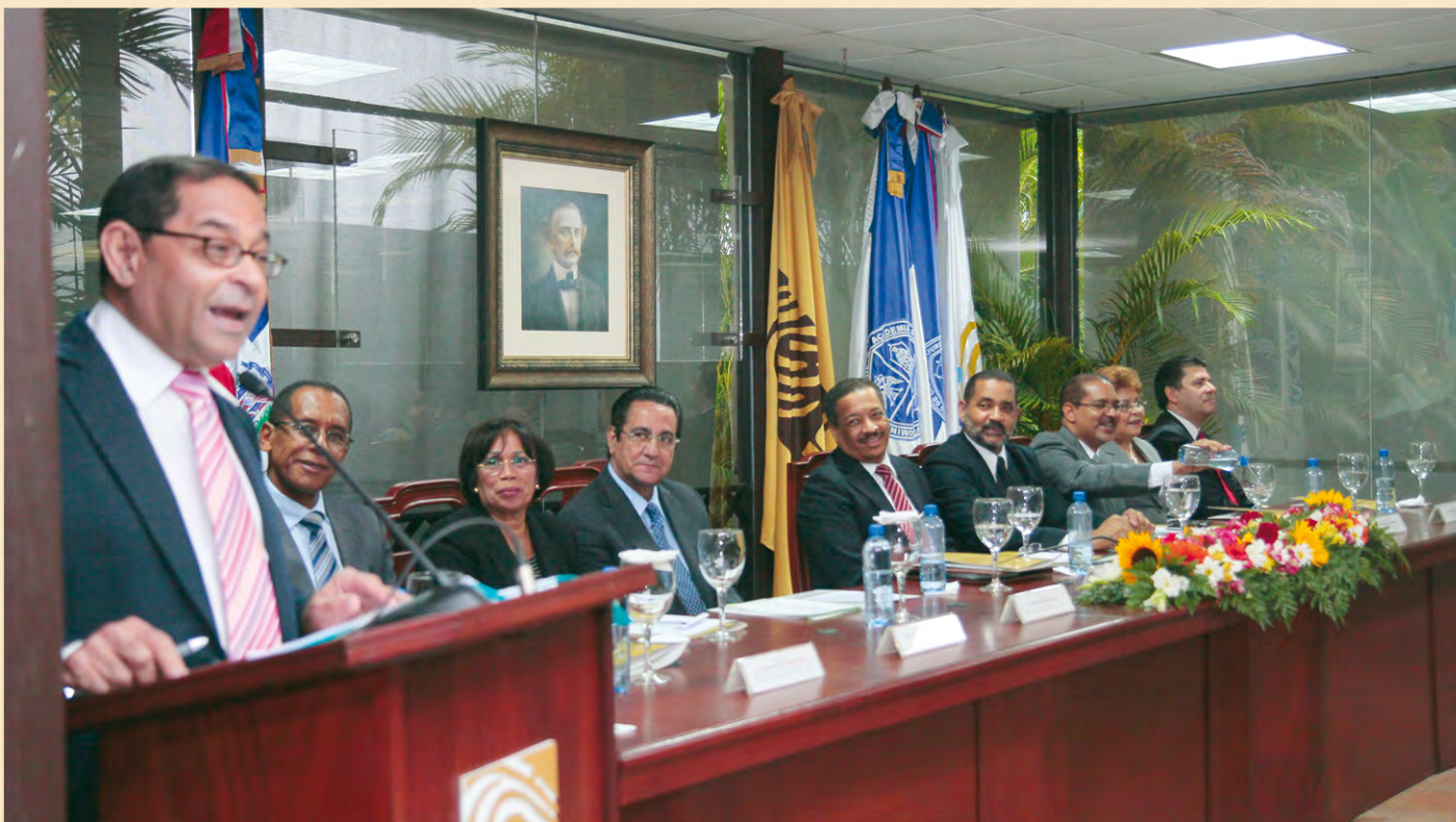
El doctor Mariano Germán Mejía, presidente de la suprema Corte de Justicia, dictó la conferencia magistral El Estado y la Organización del Sistema de Identidad Personal, en el inicio de la maestría en Derecho de Familia y Actos del Estado Civil". Pág. 9