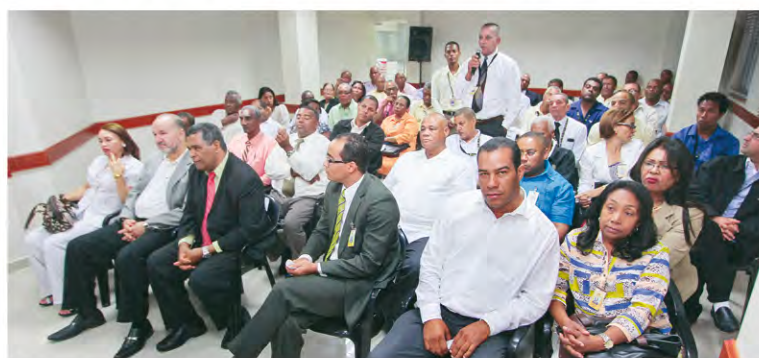
Encuentro realizado en San Juan de la Maguana.