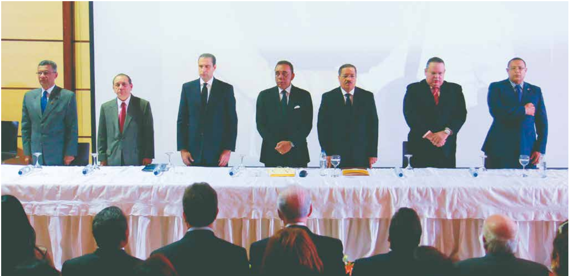
Mesa de honor que encabezó el acto.