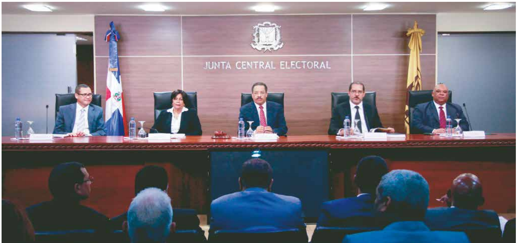
El Pleno de la JCE encabezó la audiencia.