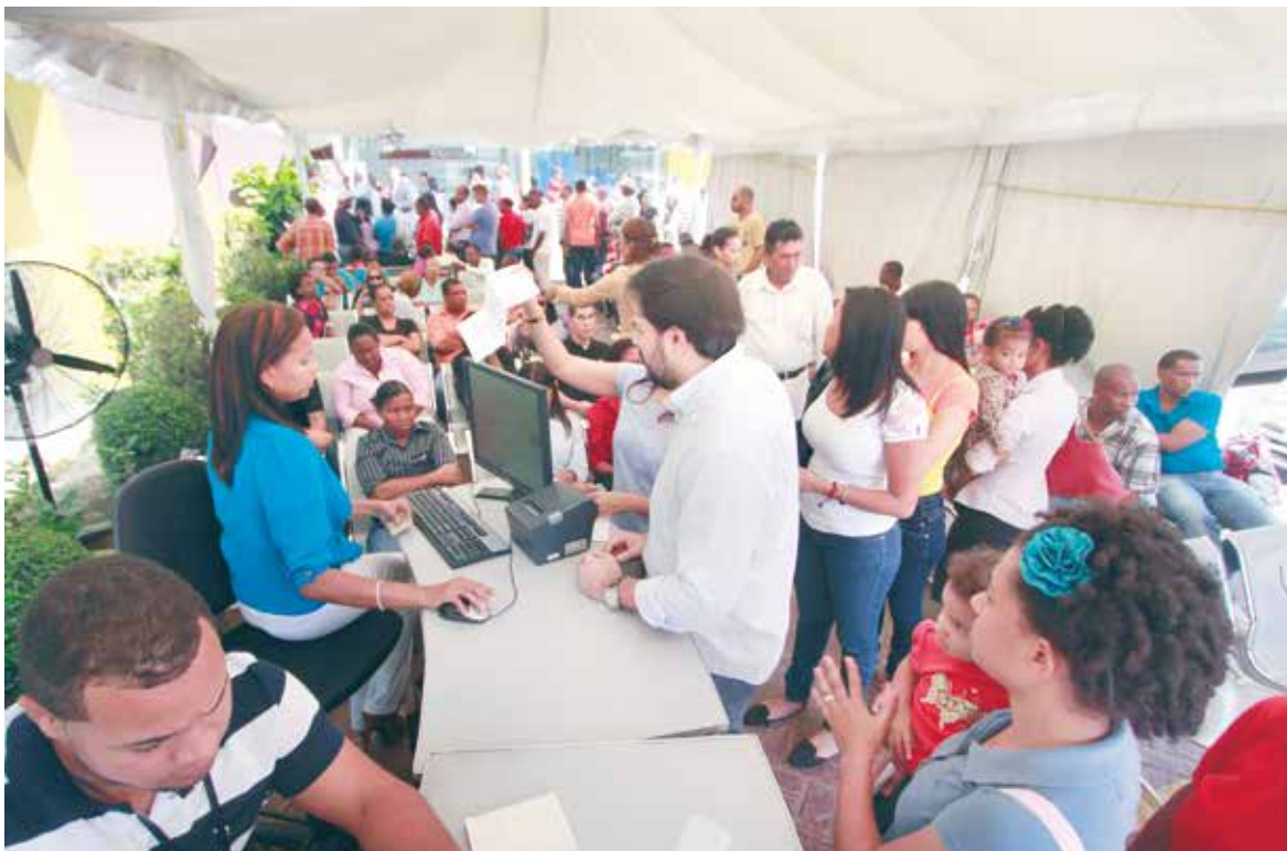
A pesar de que el plazo para el vencimiento de la vieja cédula era el 10 de enero, la JCE se mantiene abierta, recibiendo a los ciudadanos que no han podido cambiar el documento.