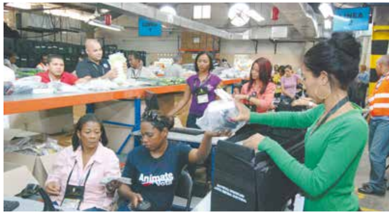
Cada una de las actividades están programadas como la preparación de las valijas para ser transportada a los recintos electorales.