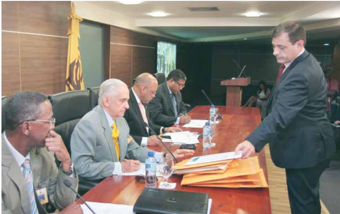
Como ya es tradición en la Junta Central Electoral las compras o contrataciones se hacen de acuerdo a lo establecido en la Ley, en base a licitaciones.

Establece que estas elecciones tendrán tres niveles de elección, es decir Presidencial, Congresual, y Municipal, para cada uno de los cuales habrá un escrutinio de los votos y debe generarse, no menos de una relación de votación, en las que se hará constar el título de cada cargo que haya de cubrirse y los nombres de las personas que figuren como candidatos, expresándose con palabras y en guarismos el número de votos alcanzados por partido y por persona, en