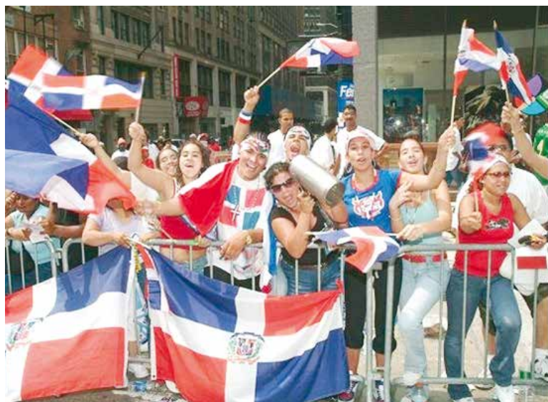
La bandera dominicana ondea en playas extranjeras como orgullo de los dominicanos.