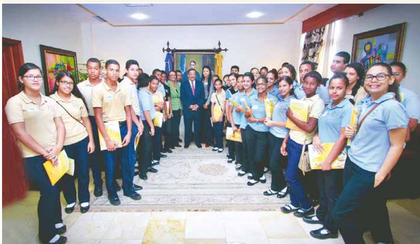
Imagen del Mes

defendamos nuestra Constitución, en el entendido de que ésta representa el alma nacional. Es lo que nos unifica y nos distingue, nos hace iguales en la Constelación de naciones independientes, democráticas; y nos hace diferentes a la vez. Con nuestras diversas formas de expresión de la dominicanidad, debemos, en consecuencia, defender y proteger la Carta Magna, colocarla por encima de nosotros, ya que, solo a través de ella, podemos garantizar las aspiraciones y apetencias de la colectividad dominicana. La Constitución de la República es un compromiso de nación, un pacto social; es el muro que quieren derribar aquellos a los que el patricio Juan Pablo Duarte llamó enemigos de la patria; por tanto, preservarla es un sagrado compromiso de las presentes y futuras generaciones, para conservar nuestra existencia como nación.