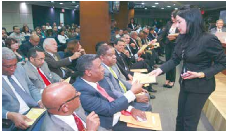
Los delegados de los partidos recibieron sus calendarios.

se llevan a cabo partiendo de un plan estructurado en seis etapas.