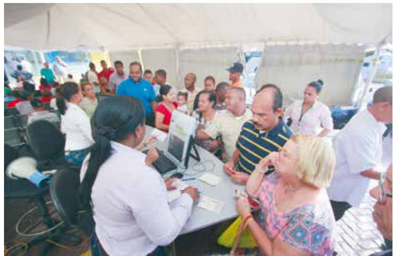
Cada día visitan los centros de cedulación entre 18 a 20 mil personas para renovar el documento.