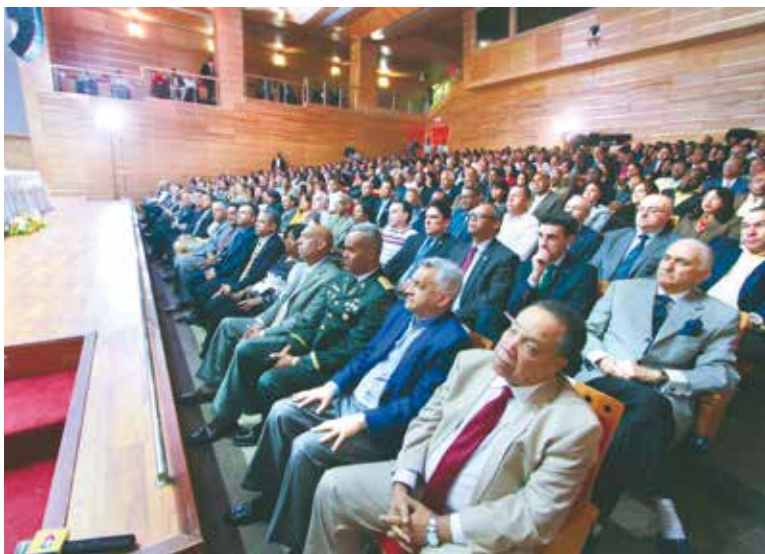
Parte del Público que acudió al auditorio, profesor Juan Bosch, de la Biblioteca Nacional.

el Plan Nacional de Regularización y la Ley 169-14, que lo aplica, son instrumentos complementarios de la sentencia del TC, que limita la adquisición de la nacionalidad dominicana.