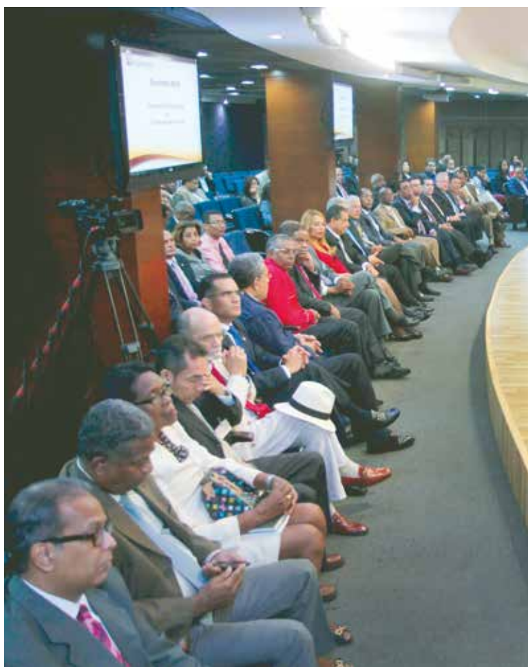
Antes de concluir sus proyectos la JCE consultó a diversos sectores, incluyendo los representantes de los partidos políticos reconocidos.

Sin aprobación de Leyes la fuerza del dinero se impondría en la elecciones