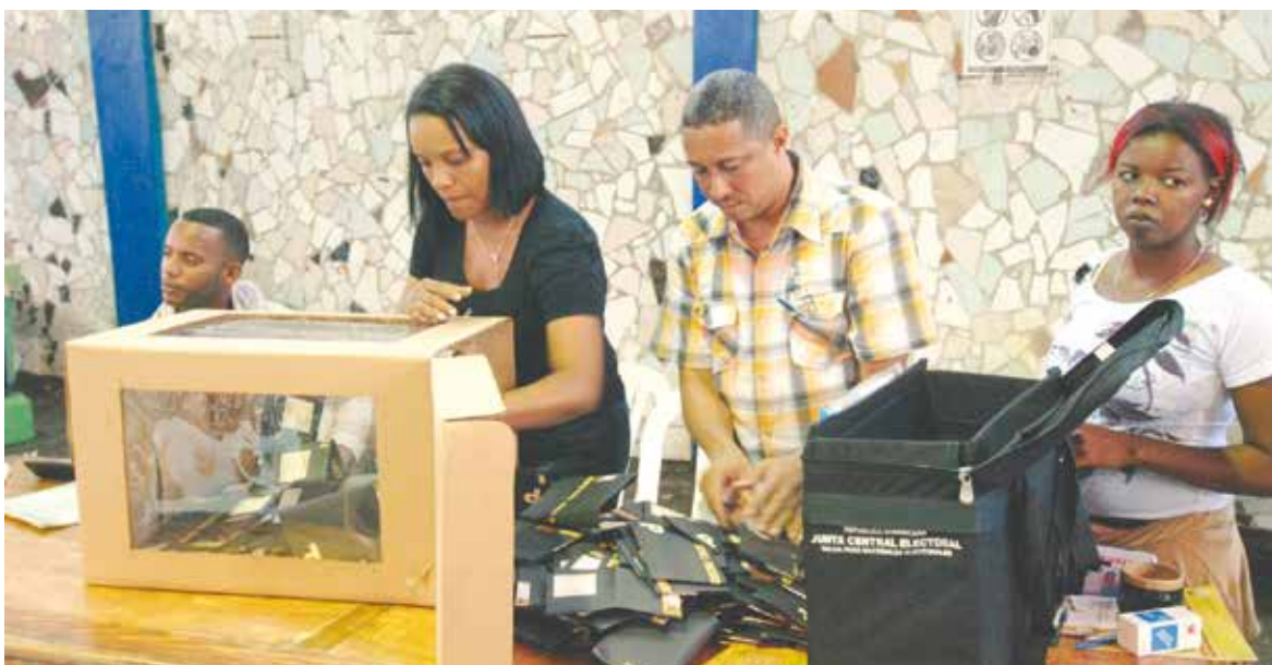
Se ha determinado que el escrutinio o conteo de votos es la parte más lenta en el proceso electoral dominicano. Se espera superar el sistema manual por uno electrónico.