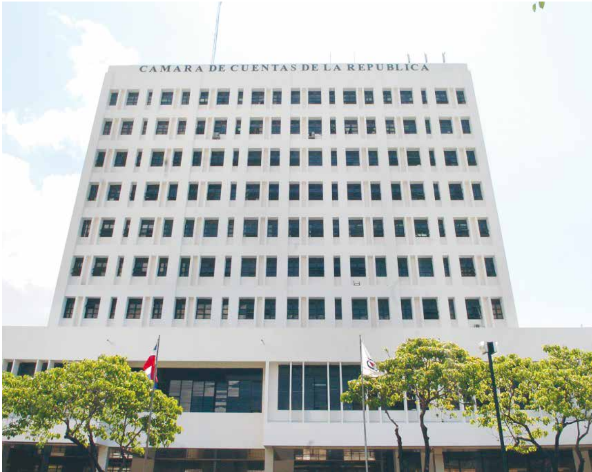
Fachada principal del edificio que alberga la Cámara de Cuentas.