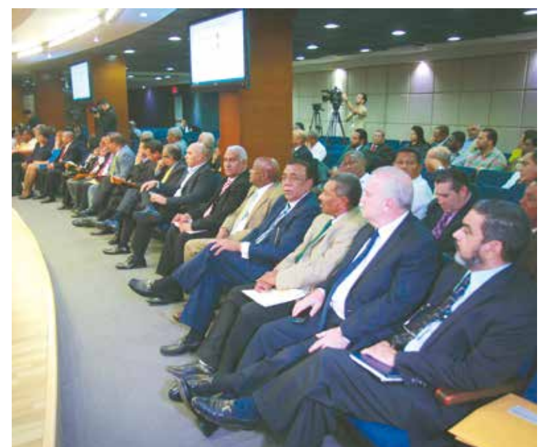
Los delegados políticos mostraron gran interés durante la exposición.