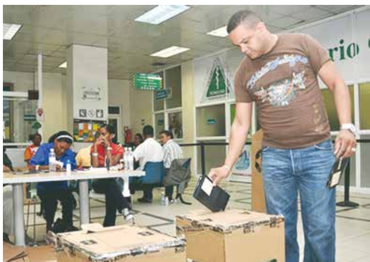
El voto de los dominicanos en exterior es considerado como clave por los partidos políticos

Indicó que la mayoría de los Centros OPREE, están localizados en las sedes consulares las cuales además, de llevar a cabo el proceso del voto en el Exterior, apoyan a los consulados con la emisión de documentos del Estado Civil, verificación de nacionalidad, emisión de la Cédula de Identidad y Electoral, Actas de Matrimonios, Empadronamiento de Electores, entre otros múltiples servicios importantes y vitales para los ciudadanos y ciudadanas dominicanos residentes en esas latitudes. Valoró y dimensionó como altamente positivo este acuerdo con el Ministerio de Relaciones Exteriores, para ayudar a los dominicanos de la diáspora en la expedición de sus documentaciones personales.