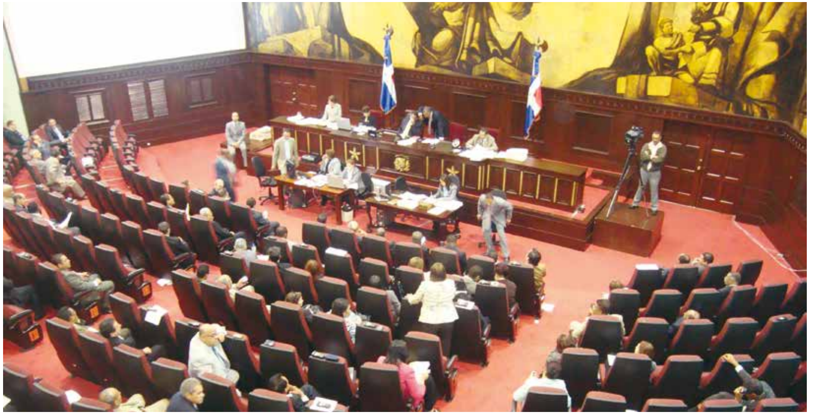
En distintas ocasiones, y por varias vías, la Presidencia de la Junta Central Electoral ha introducido al Congreso Nacional los proyectos de Leyes de Partidos Políticos y el del Régimen Electoral.

Agrega que el proyecto en cuestión fue elaborado tomando