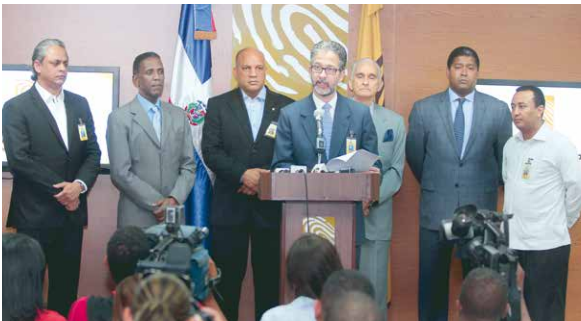
Comisión de Licitaciones de la JCE que dirige el proceso, junto a otros funcionarios de la institución.