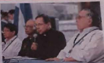
La mesa de negociación está presidida por el cardenal Leopoldo Brenes y el nuncio Waldemar Starobinski. (C.D.)

El Gobierno hasta ahora no ha divulgado sus intereses, aunque el Ejecutivo ha dicho expresamente que su objetivo es tocar temas económicos.