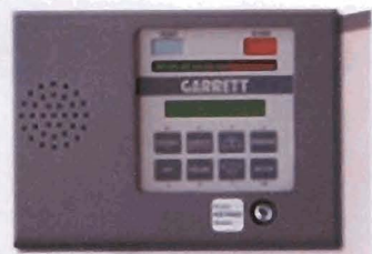
The PD 6500i's access control panel is designed for use with specific, multi-level security codes.