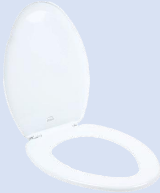
TAPA PARA INODORO ELONGADA EASTMAN