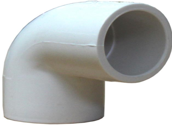
CODO PVC DE PRESION DE 3/4X90