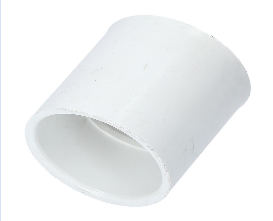
COUPLING PVC DE \frac{3}{4}