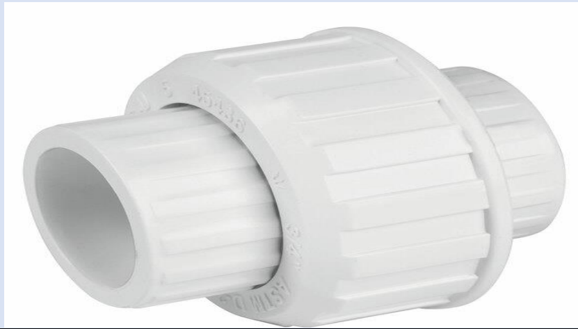
UNION UNIVERSAL PVC DE 3/4