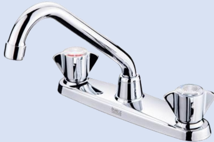
LLAVES PARA LAVAMANOS SENCILLA ½ CON PUÑO Q URREA 242Q