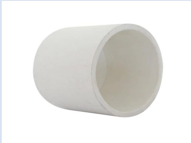
TAPON PVC HEMBRA DE 3/4