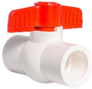
LLAVE DE PASO PVC DE BOLA DE 1