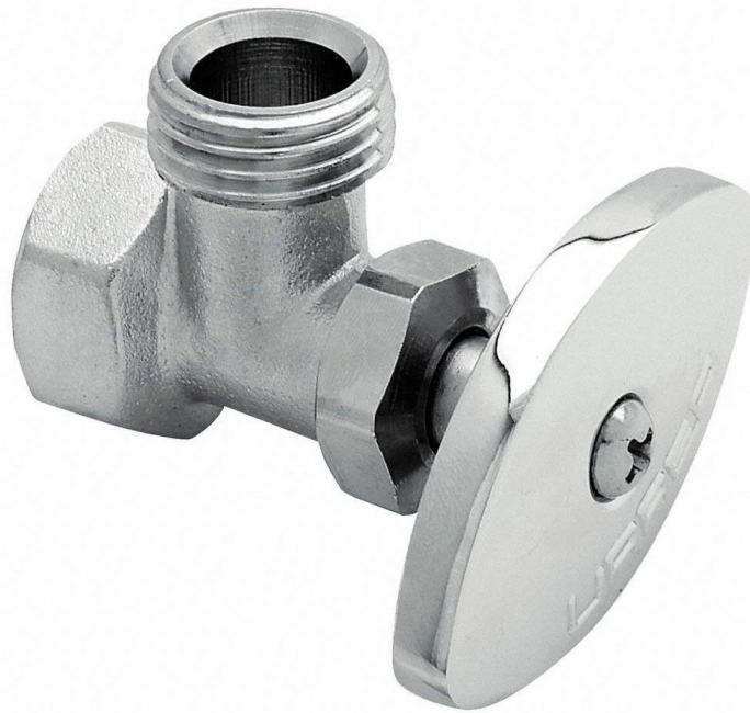
LLAVE ANGULAR DE UNA SALIDA DE 3/8 X 3/8