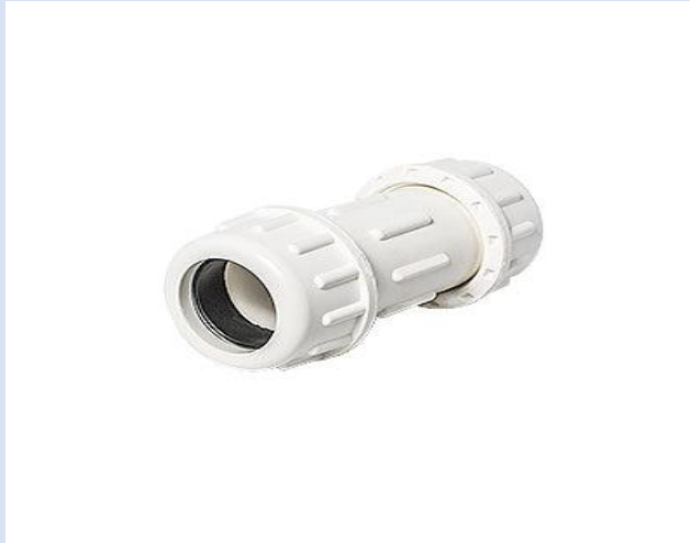
UNION DRESSER PVC DE 3/4