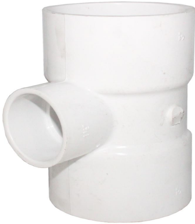
TEE PVC DRENAJE DE 4