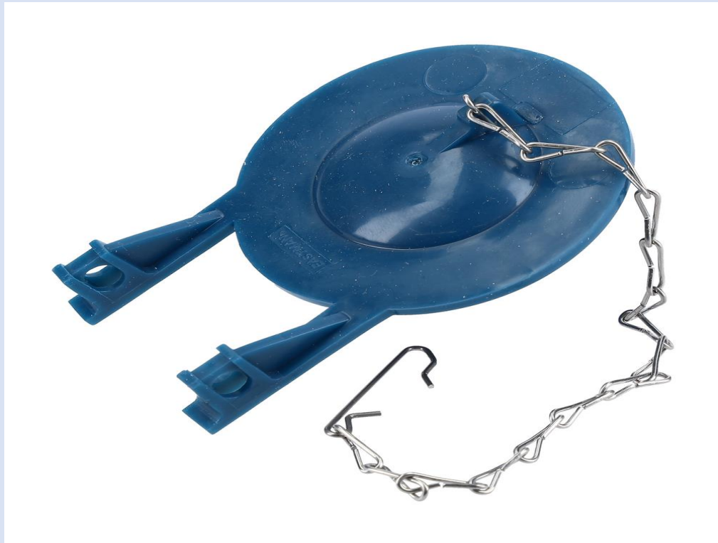
PERA INODORO DE 3 FLUIDMASTER