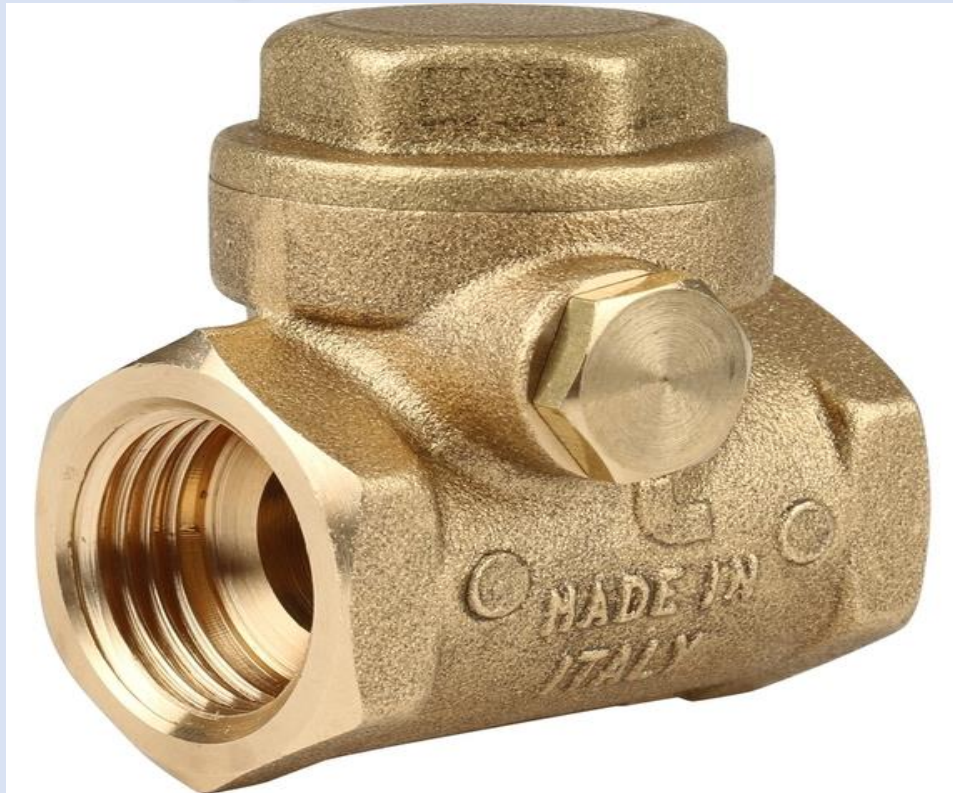
CHEQUE VERTICAL DE BRONCE DE 3/4