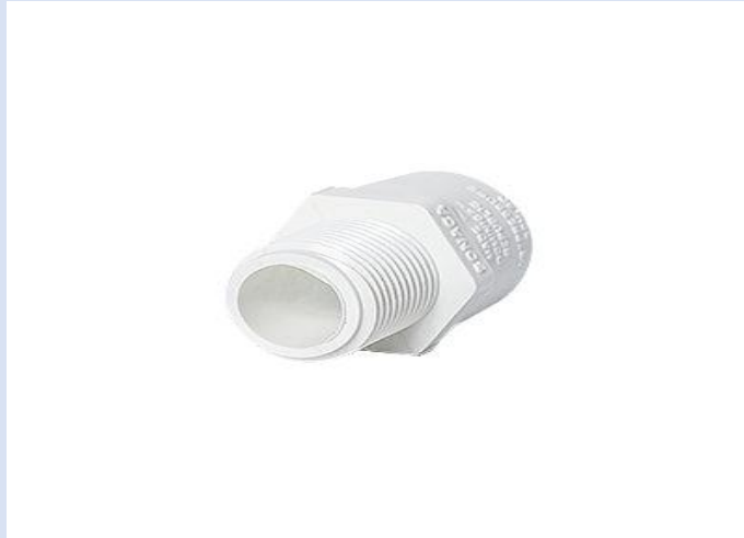
ADAPATADOR PVC MACHO 3/4