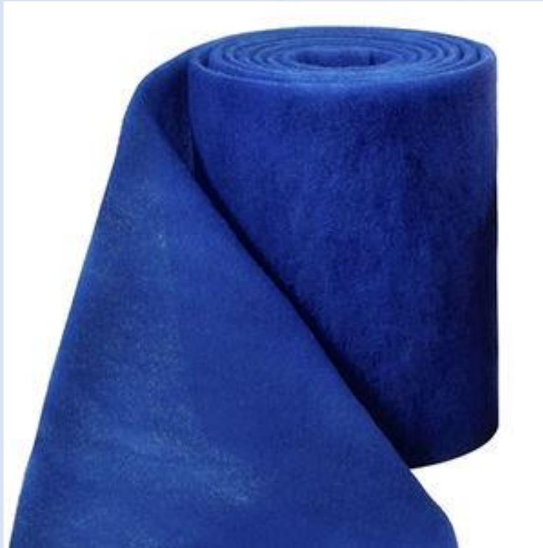
FIBRA VEGETAL (PIE)