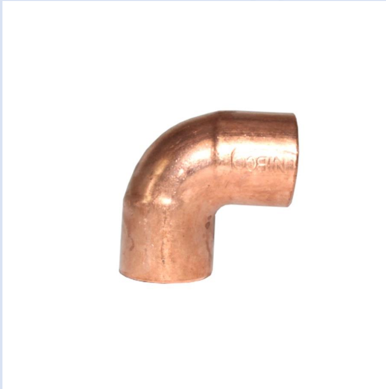
CODO DE COBRE (3/4")