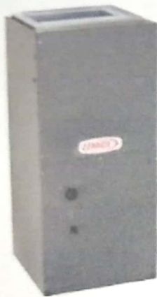
AIRE INVERTER 5 TONS. T/MANEJADORA R-410A 208-230V EFICIENCIA 18 (MARCA UNITED O LENNOX) SERPERTIN EN COBRE MONOFASICO (1HP) 220-230V