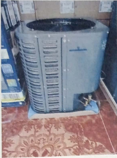
AIRE INVERTER 5 TONS. T/MANEJADORA R-410A 208-230V EFICIENCIA 18 (MARCA UNITED O LENNOX) SERPERTIN EN COBRE MONOFASICO (1HP) 220-230V