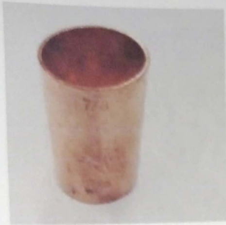
CODOS DE COBRE 7/8 X 90