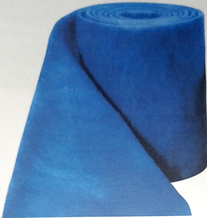
ROLLO DE FILTRO VEGETAK AZUL