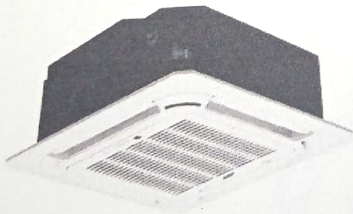
AIRE INVERTER 5 TONS. T/CASSETTE R-410A 208- 220V EFICIENCIA 18 (MARCA UNITED O LENNOX) SERPERTIN EN COBRE MONOFASICO (1HP) 220- 230V