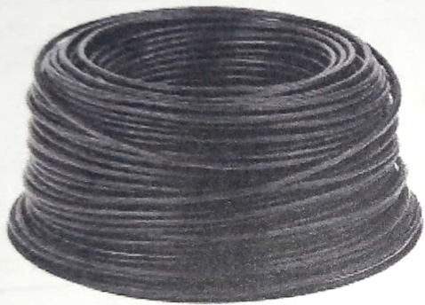
PIES ALAMBRE DE GOMA No. 14-4