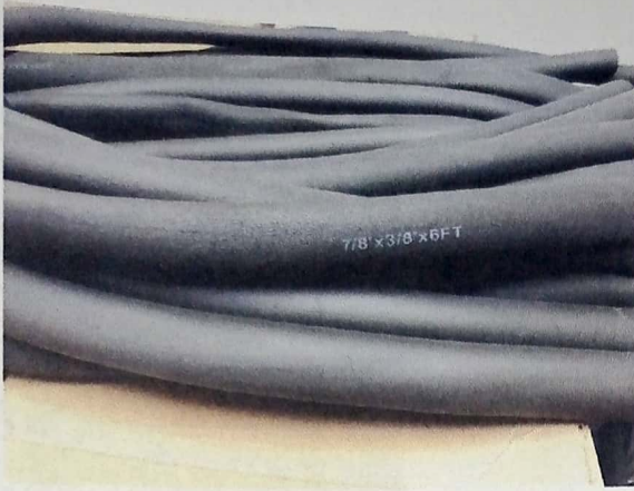
VASCOCELL 7/8 X 3/8 X 6 FT