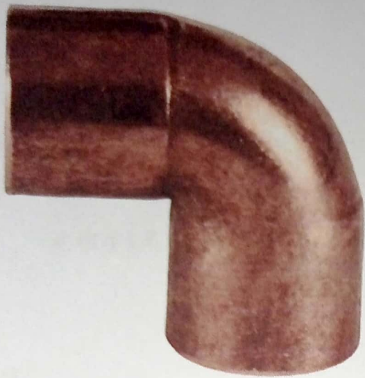
CODO DE COBRE 3/8 x 90