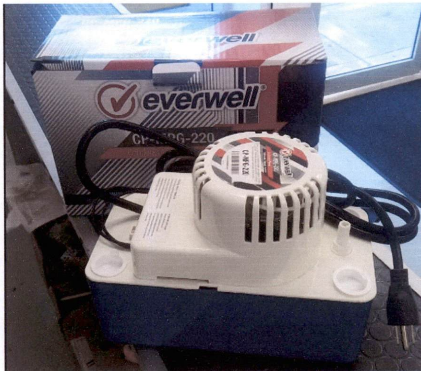
BOMBA DE DRENAJE 220V GRANDE