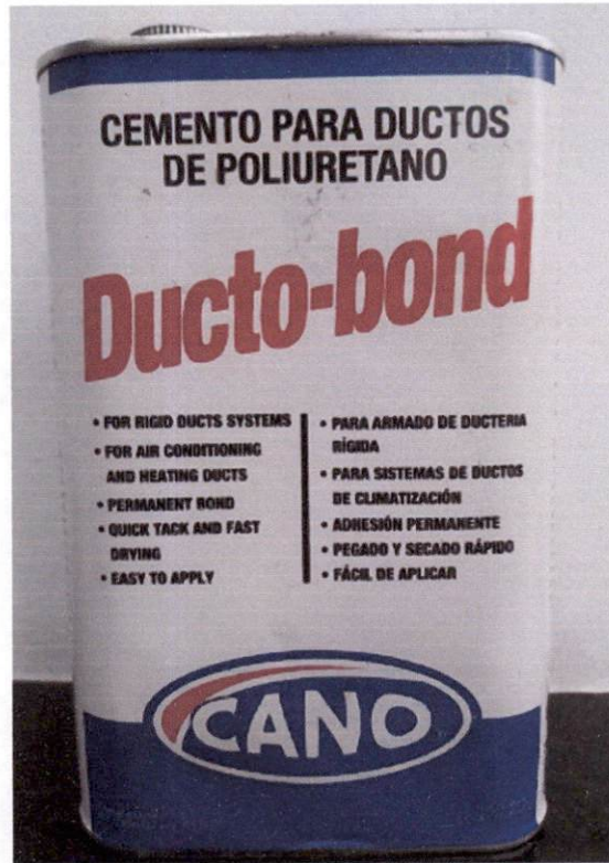
CEMENTO POLIURETANO P/PLANCHA P3 CANO