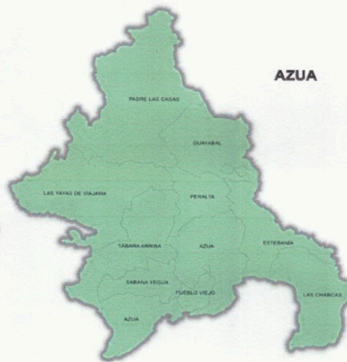
Mapa provincia de azua