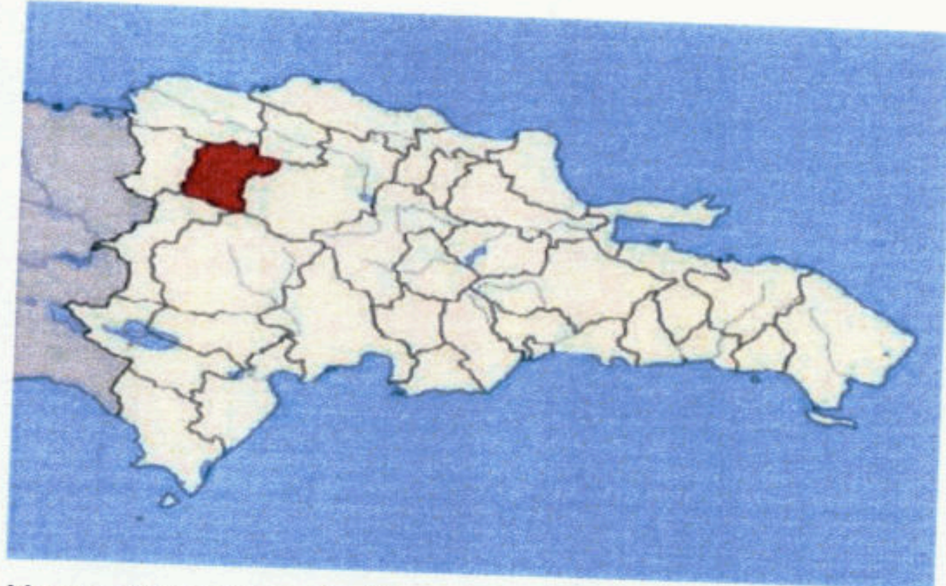
Mapa 1 Ubicación prov. Santiago Rodríguez

El municipio de San Ignacio de Sabaneta posee una superficie de 801.37 Km 2 con una densidad de 43.1 habitantes por km 2 . Está situado en la parte Noroeste de la República Dominicana. Al norte comparte planicies con Guayubín, al oeste con el Municipio de Partido, El Pino y Villa Los Almácigos, al sur de su territorio con Pedro Santana y San Juan, y al este con Mao, Monción y San José de Las Matas. El municipio se localiza específicamente en la 19° 25' Latitud Norte y 71° 29' Longitud y forma parte de la Región Cibao