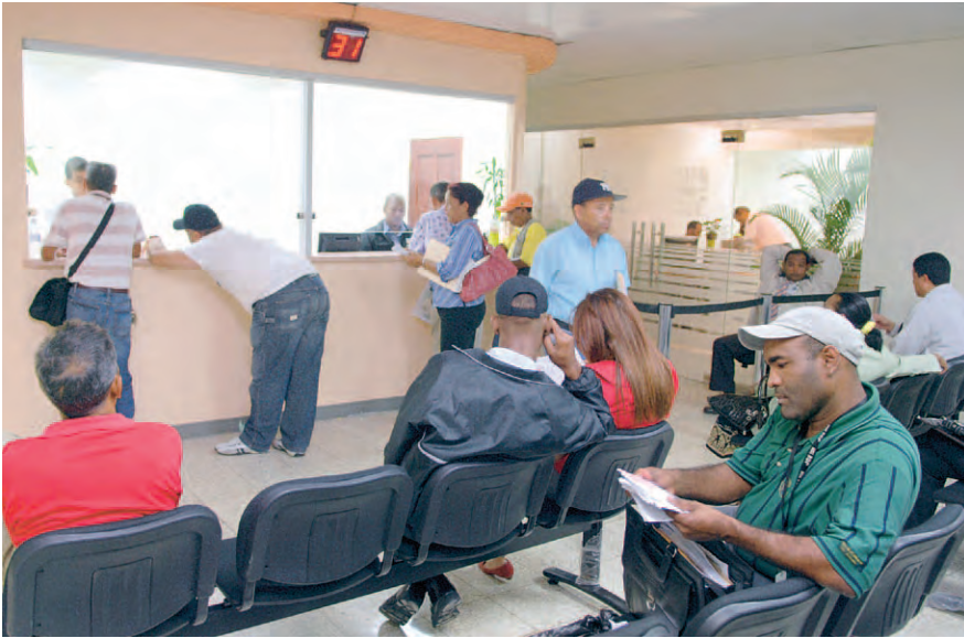
Las atenciones a los ciudadanos es lo principal.