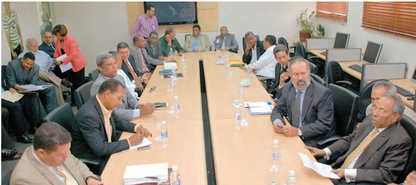
La JCE explicó a los partidos políticos que deben tener al día sus libros contables.