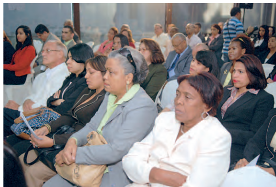
Parte del público que asistió a la actividad.