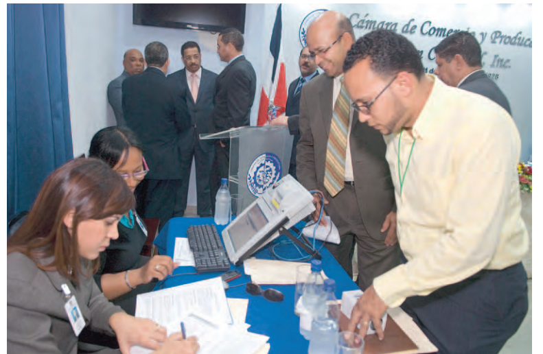
Técnicas del Departamento de Inspección recibieron las propuestas.

Recordó la importancia que tienen estas elecciones, pues además de la elección del Presidente y el Vicepresidente de la República serán escogidos por primera vez siete diputados de ultramar.