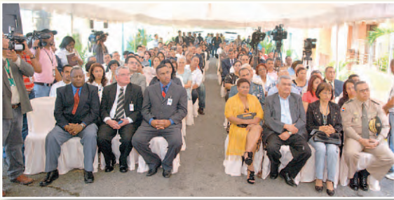
Vista parcial del público que asistió al Acto de inauguración de las nuevas instalaciones de la JCE en Altamira.