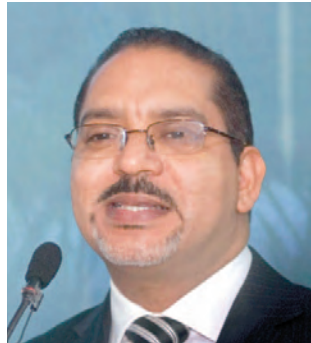
El magistrado José Ángel Aquino Rodríguez, aspira a porcentajes igualitarios en las candidaturas de Hombres y Mujeres.

La edición compila las ponencias de esa actividad celebrada en octubre del 2008 y fue entregada a propósito de celebrarse