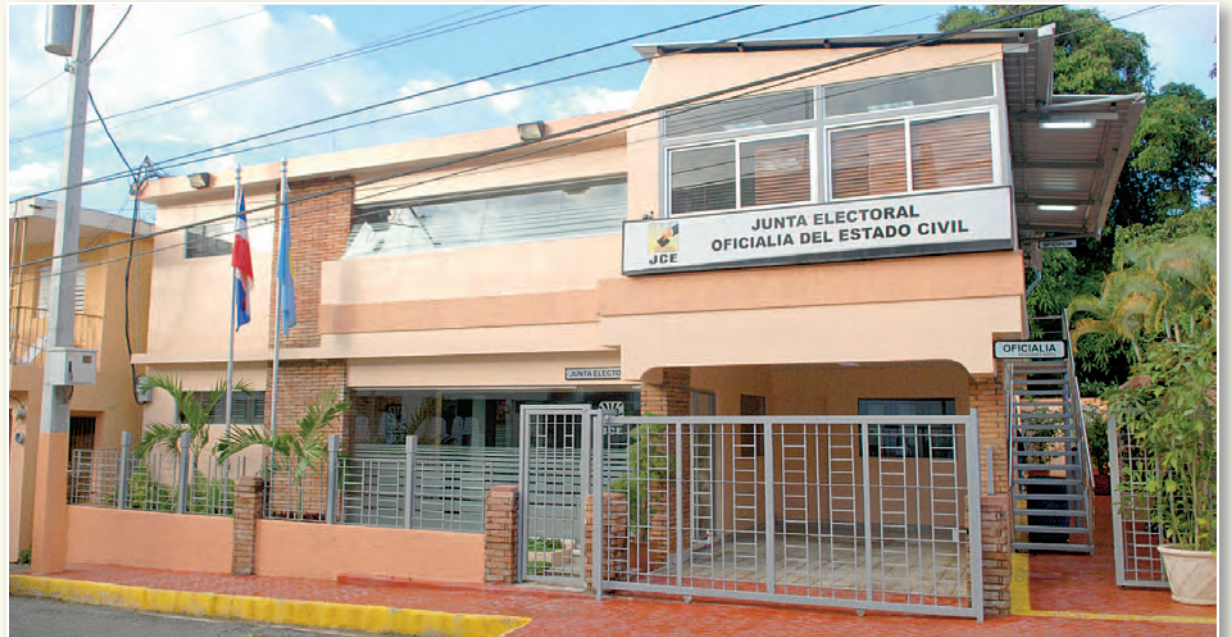
Vista parcial del moderno edificio electoral del municipio de Altamira, ubicado en la Calle Duarte No.37, donde operan la Oficialía del Estado Civil, la Junta Electoral y un Centro de Cedulación y Captura de Datos Biométricos.