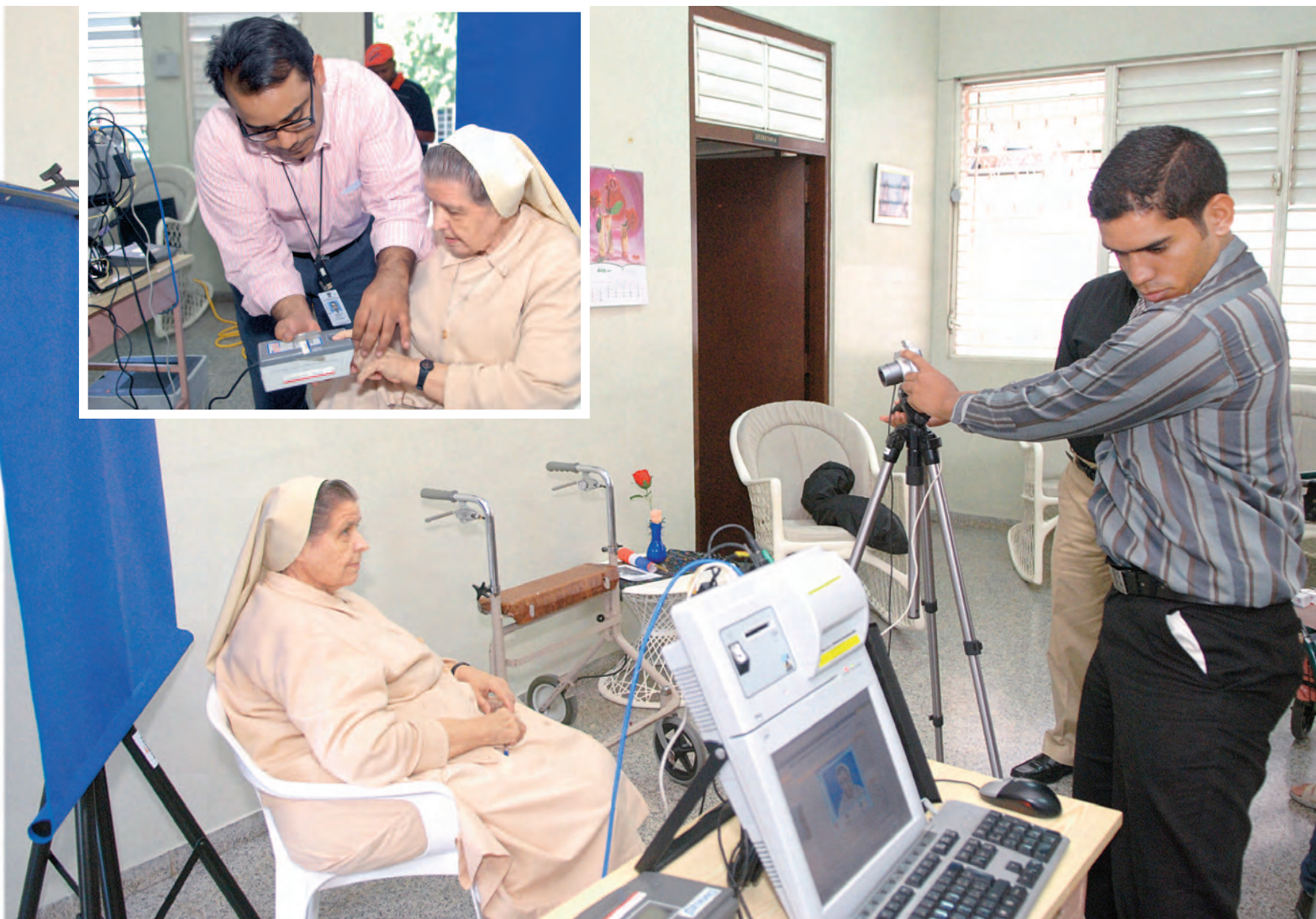
Técnicos del Departamento de Cedulación en plena faena. Del 2001 a la fecha se han realizado 88 operativos como éste.