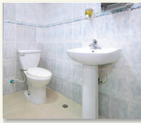
Vista parcial de uno de los baños disponibles para el público.