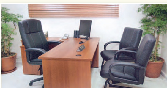
Vista parcial del Salón de Sesiones de la Junta Electoral de Altamira.