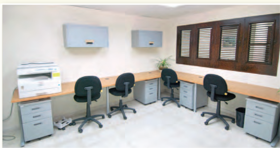
Vista parcial de la Sala de Espera desde donde los ciudadanos podrán esperar cómodamente su turno para recibir los servicios que requieran. Se trata de una sala climatizada, con televisor plasma para el entretenimiento y orientación de los usuarios, quienes dispondrán de tickets para mejor organización de los turnos, que se asignarán por orden de llegada.