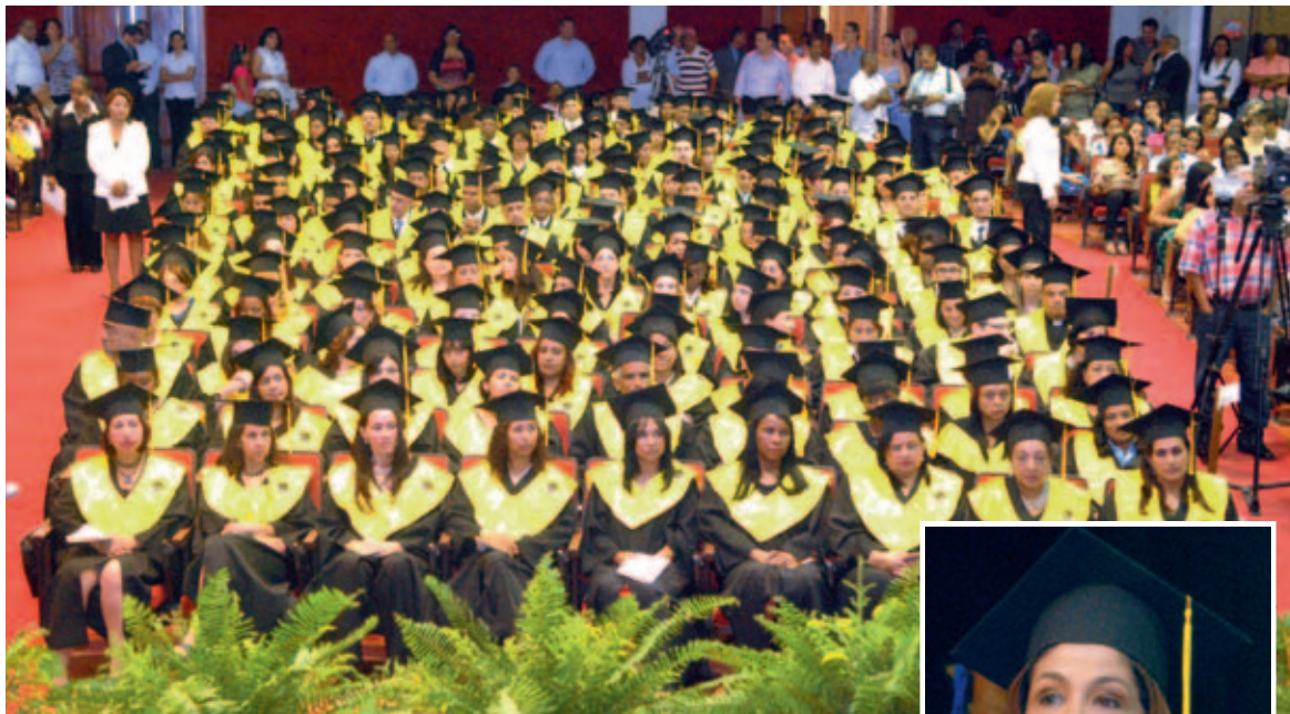
La UTE entregó 200 nuevos profesionales al país.

En ese sentido se preguntó ¿En estas circunstancias, qué esperan los ciudadanos de la JCE?, para agregar que “a decir