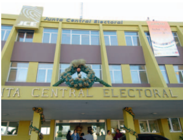
Bajante colocado en la parte frontal del edificio sede de la JCE.