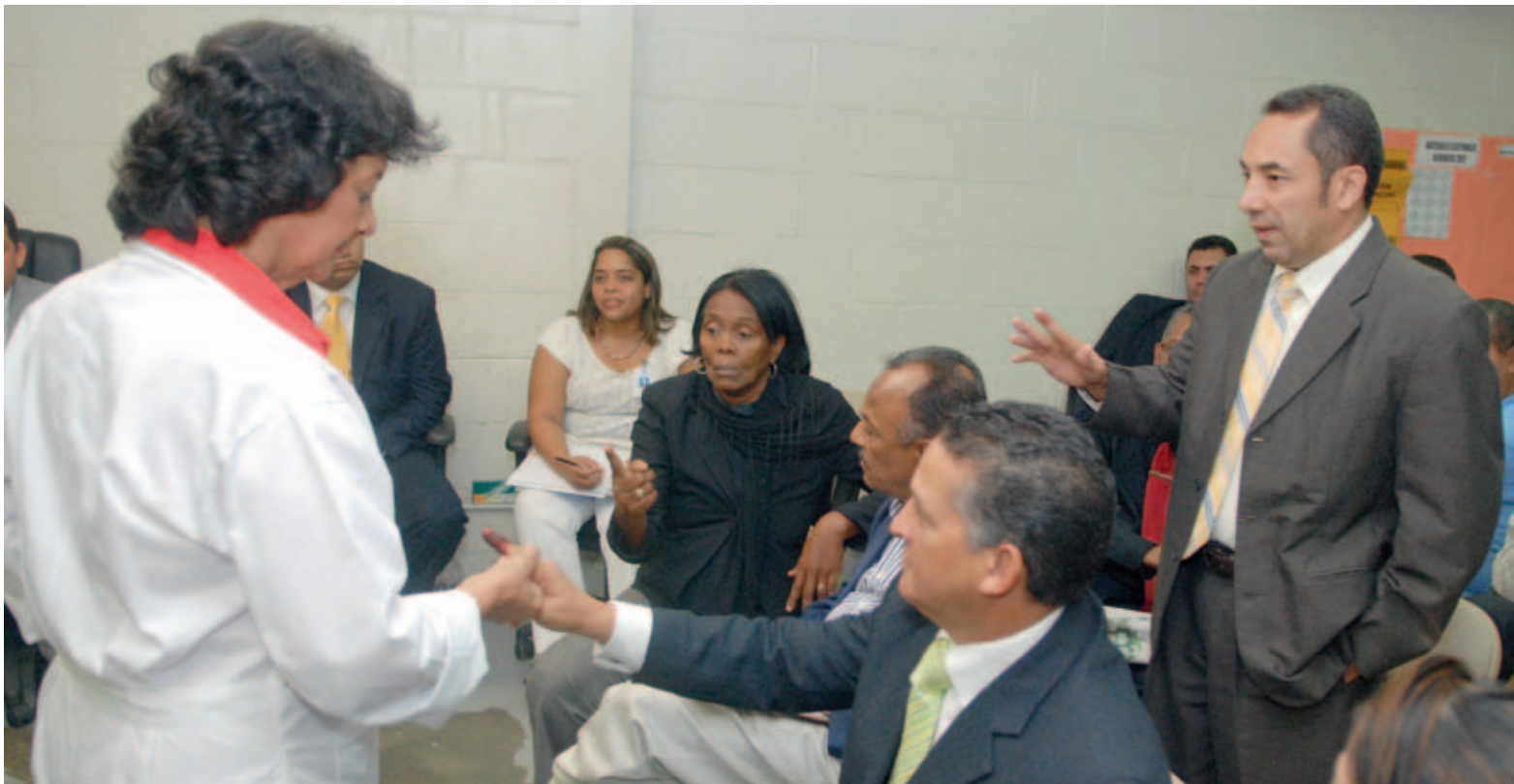
Una de las profesionales comprueba la calidad de los tintados usados con los delegados políticos.