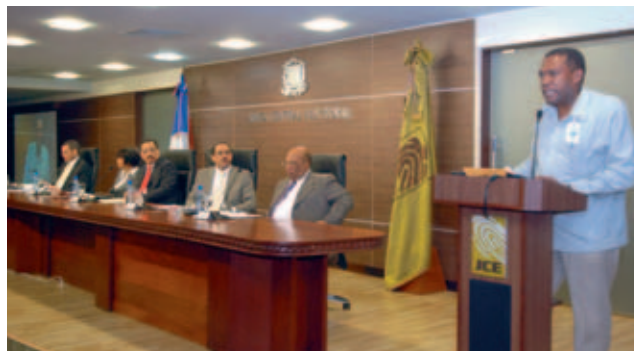
Es una tradición que los delegados de los partidos opinen libremente ante las propuestas del pleno de la JCE.