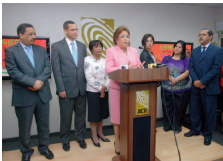
La ministra de la Mujer, Alejandrina Germán, valoró como positivo la integración del personal de la JCE a las actividades.

centros de asistencia al público, va a estar en el edificio del Centro de los Héroes, la Oficialía de la 2da., Oficialía de la 3ra. Santiago de los Caballeros, San Francisco de Macorís, en el Centro de Servicio de la Carretera Mella y en La Romana "y otros lugares de mucha asistencia al público, por-