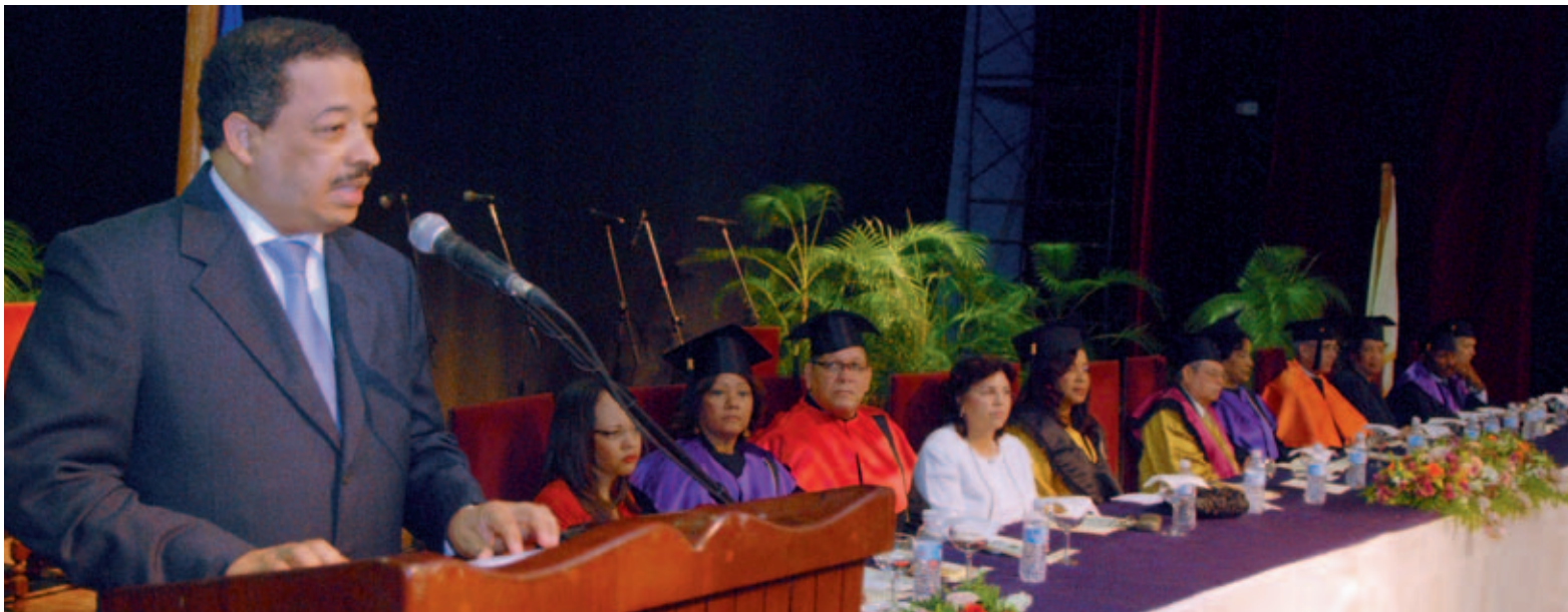
El presidente de la JCE se dirige a las autoridades y alumnos de la UTE en el acto de graduación.