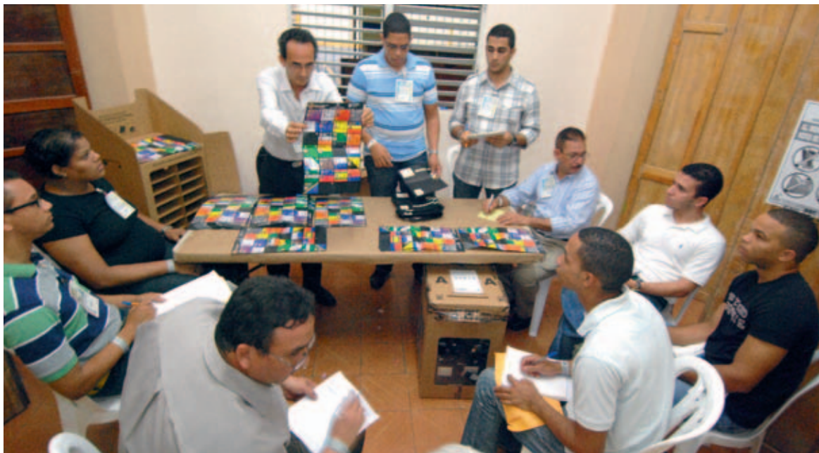
Los responsables del Colegio Electoral muestran a los delegados de los partidos el rayado de una boleta.

► Dirección de Elecciones capacita a miles de ciudadanos