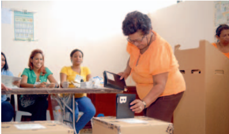
Una mujer ejerce su derecho al voto tras ser autorizada por el equipo de trabajo del Colegio Electoral.