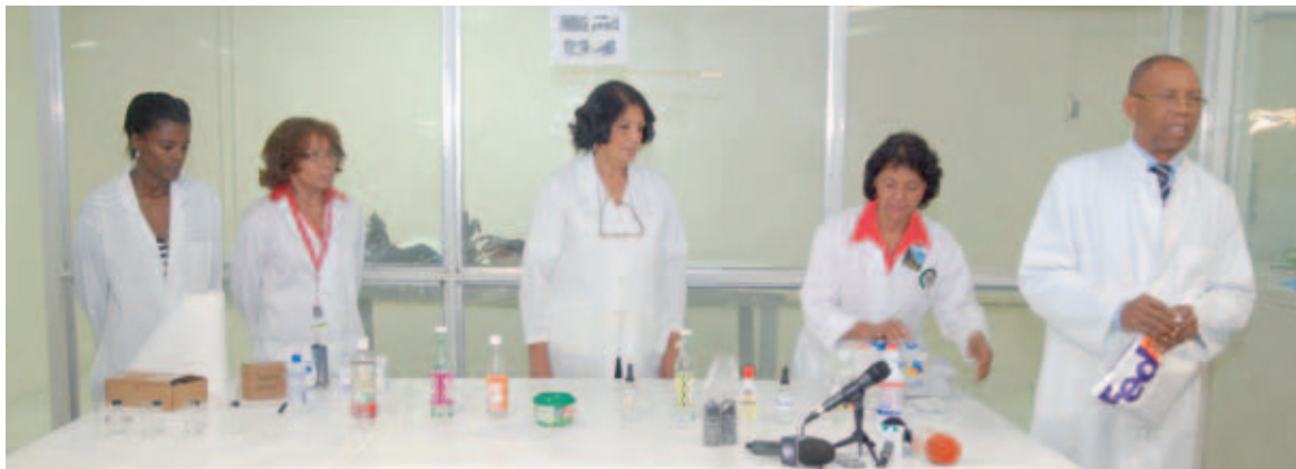
Profesionales de distintas universidades explican a los delegados políticos la forma en que comprobaron que la tinta a utilizarse en las elecciones es indeleble.