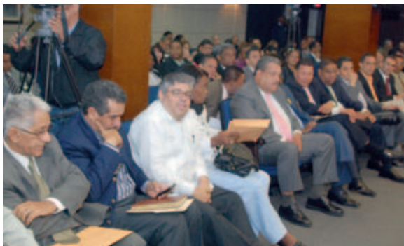
Delegados de los partidos reconocidos por la Junta Central Electoral.

La constancia de esas designaciones consta en actas de sesiones de trabajo en la Junta Central Electoral (JCE), de las que también reposan comunicaciones favorables de los partidos Revolucionario Dominicano (PRD), de la Liberación Dominicana (PLD), Reformista Social Cristiano (PRSC), Alianza Social Demócrata (ASD) Unión Demócrata Cristiana (UDC), Revolucionario Independiente (PRI), Partido de la Unidad Nacional (PUN) y Partido Nacional de Veteranos y Civiles (PNVC).