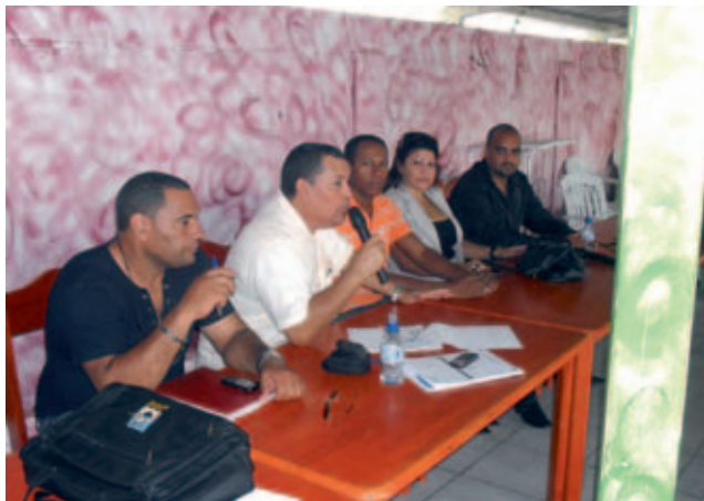
En Guyana la cedula ha sido un éxito.