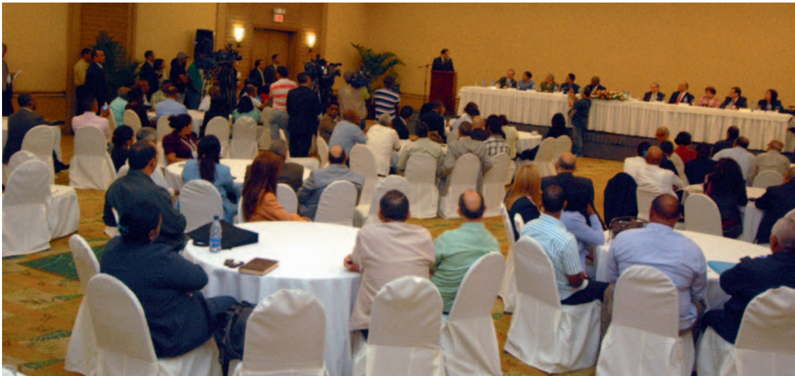
El presidente de la JCE se dirige a los delegados de organizaciones de la sociedad civil interesados en observar el proceso electoral.