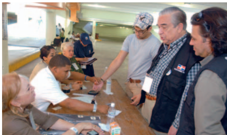
Observadores internacionales conversan con integrantes de un Colegio Electoral.

Recordó que los juicios de los observadores electorales deben ajustarse a los criterios más exigente en materia de exactitud en la información e imparcialidad del análisis, distinguiendo los factores subjetivos de las pruebas objetivas. Dijo que los observadores deben basar todas las conclusiones en pruebas fácticas y verificables y no extraer conclusiones prematuramente, como estable-