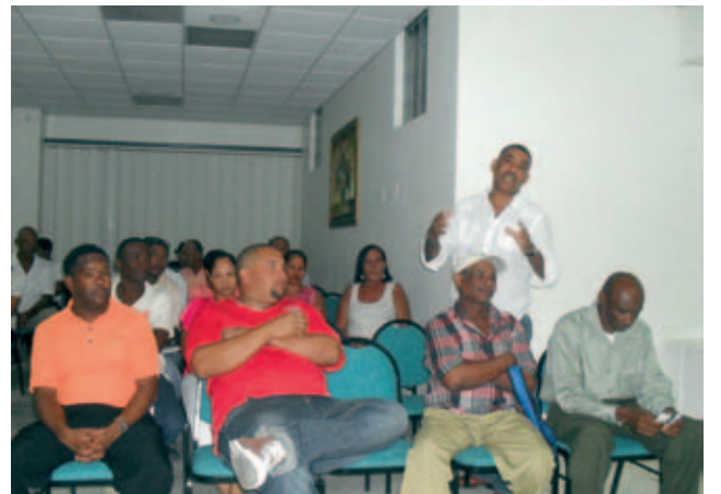
Los residentes en Antigua acuden a la cita.