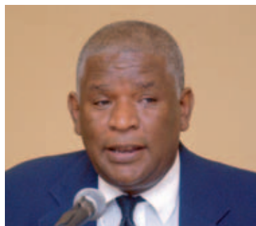
Manuel Mercedes de los Derechos Humanos.