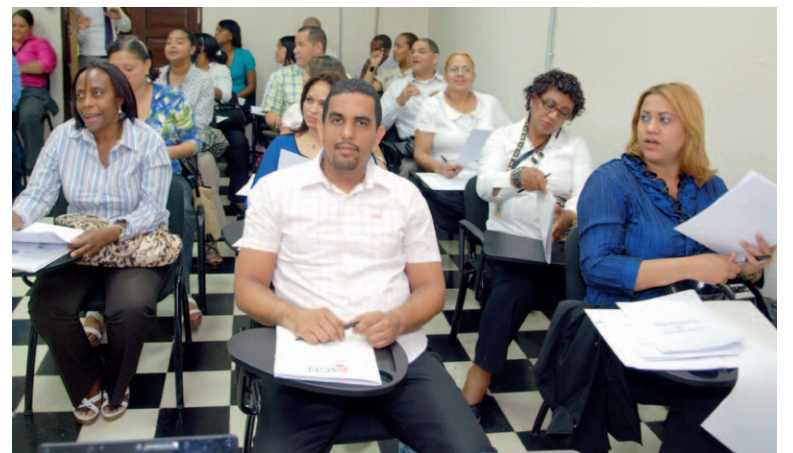
Parte del personal de la JCE que participó en la actividad.

El departamento de Conservación y Servicios Técnicos del AGN, está a cargo de la capacitación; con tres Módulos y seis unidades cuyos responsables