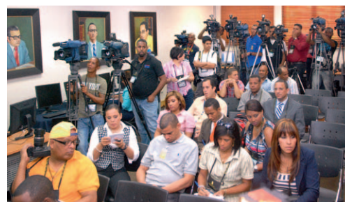
Los reporteros de los medios de comunicación siguieron atentos el proceso electoral.