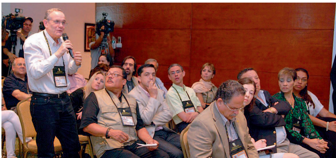
Previo a las elecciones los observadores conversaron con los candidatos presidenciales.

ción y entrega de los materiales, la alta capacitación de todos los funcionarios electorales y el uso eficiente de las tecnologías para facilitar