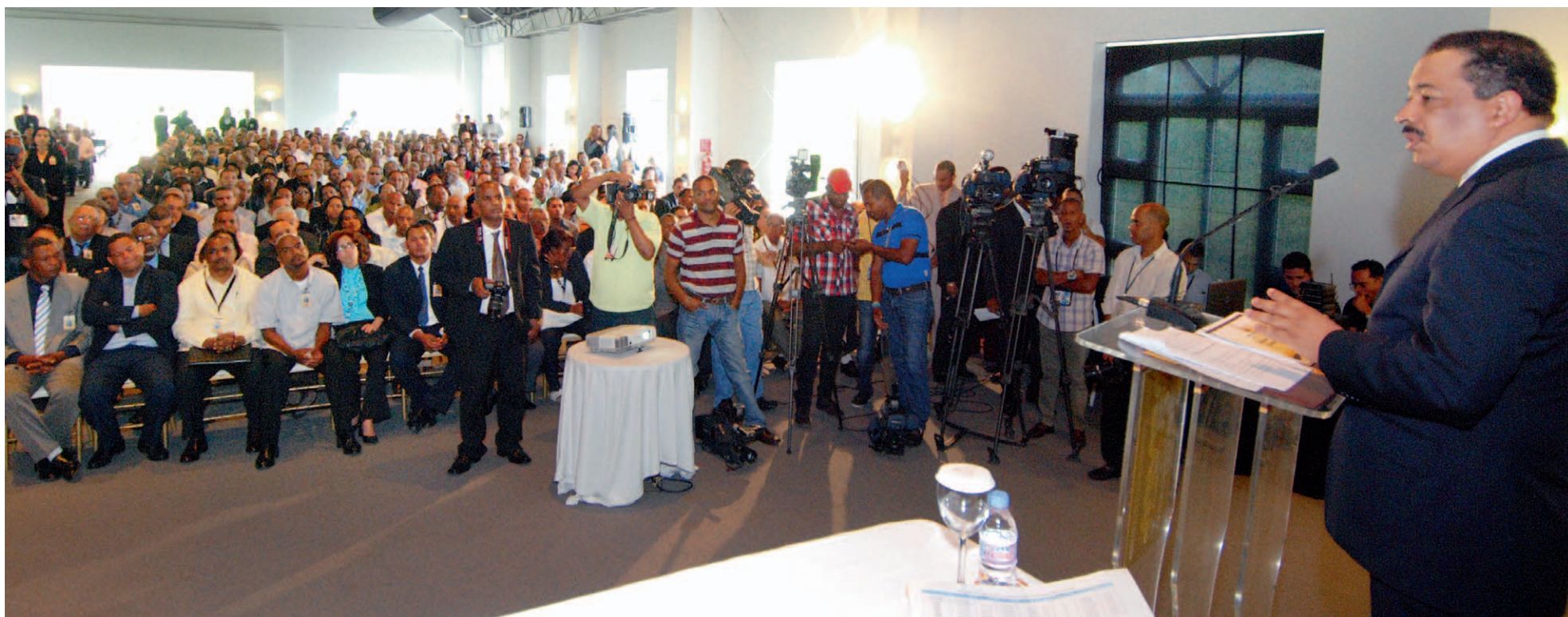
El presidente de la JCE, Roberto Rosario Márquez se dirige a los presidentes y secretarios de Juntas Electorales en el encuentro de evaluación del pasado proceso electoral.