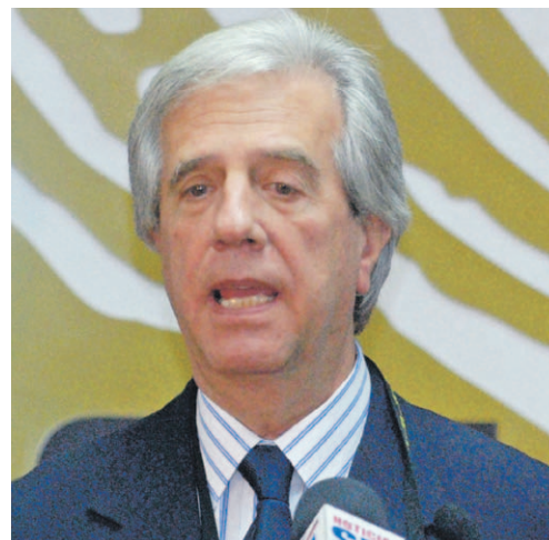
Dr. Tabaré Vázquez, ex Presidente de la República de Uruguay y Jefe de la Misión de Observación Electoral de la OEA.