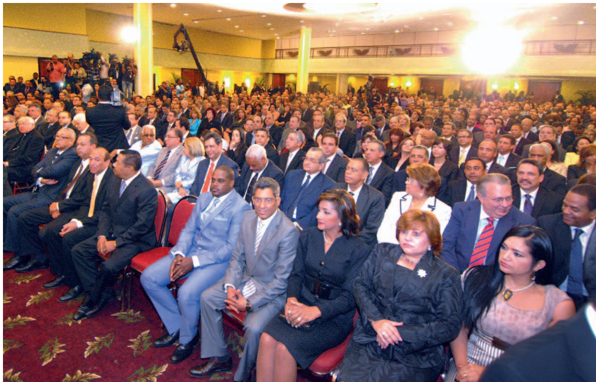
Personalidades presentes en el acto de entrega de certificados.

lo catalogaron los observadores internacionales al recibirlos esa misma noche en nuestro Despacho", puntualizó.