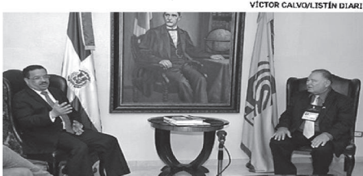
El embajador de los Estados Unidos, Raúl Yzaguirre, visitó anoche al presidente de la JCE, Roberto Rosario.

Hoy es lunes, y como hemos visto el mundo, y en el mismo la República Dominicana, no terminó ayer. Es necesario continuar. El país tiene grandes metas por delante que juntos debemos alcanzar. La palabra de la hora es unidad y mirar hacia adelante.