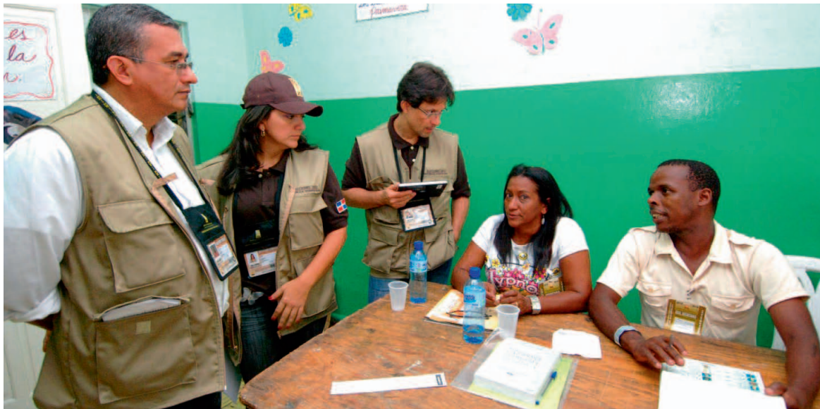
Observadores conversan con personal de los colegios Electorales.

En este sentido, la MOE/OEA observó la oportuna distribu-