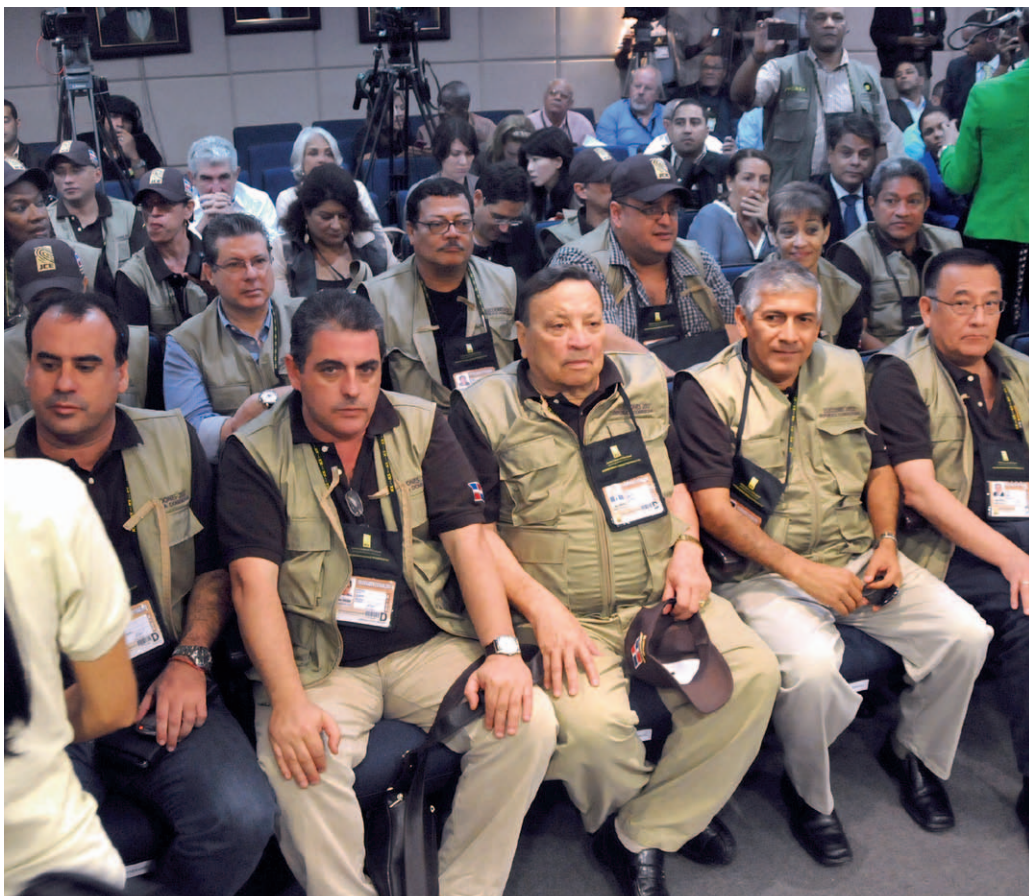
Observadores internacionales y representantes de partidos políticos reunidos en el Auditorio de la JCE para escuchar el primer boletín del Cómputo Electoral.