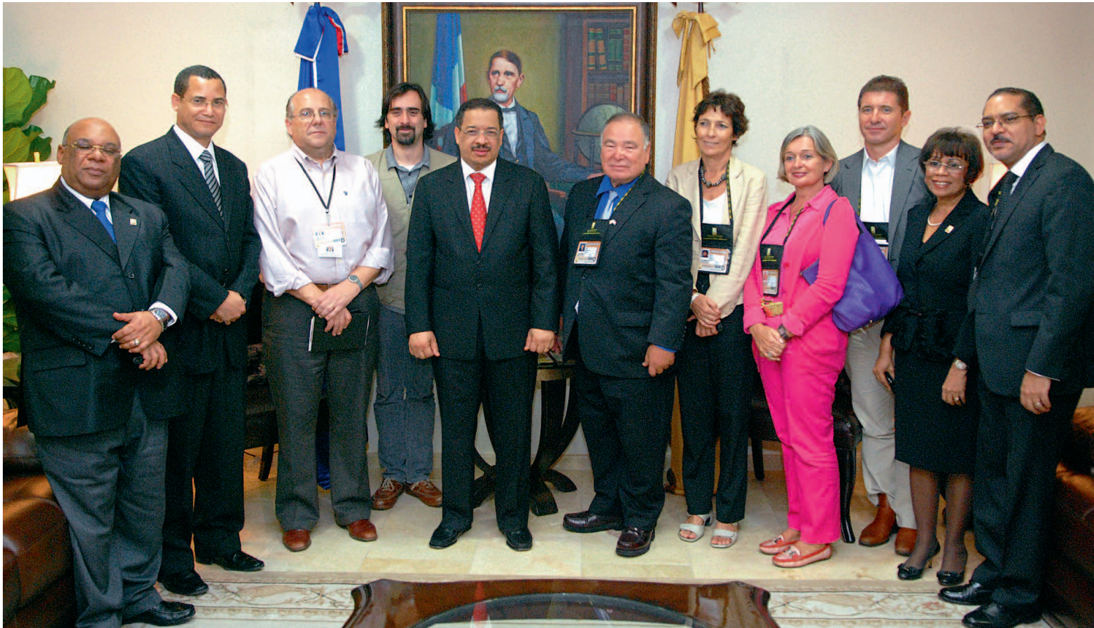
Delegación de diplomáticos encabezados por el embajador de los Estados Unidos en el país visitaron al Pleno de la Junta Central Electoral para felicitarle por éxito de los comicios.

“ El pueblo dominicano ejerció su derecho democrático de votar y, al hacerlo, reafirmó el compromiso del país con la democracia”