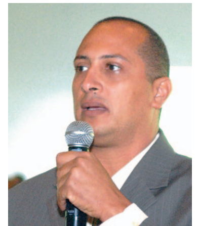
Durante el encuentro se dio participación a los secretarios.