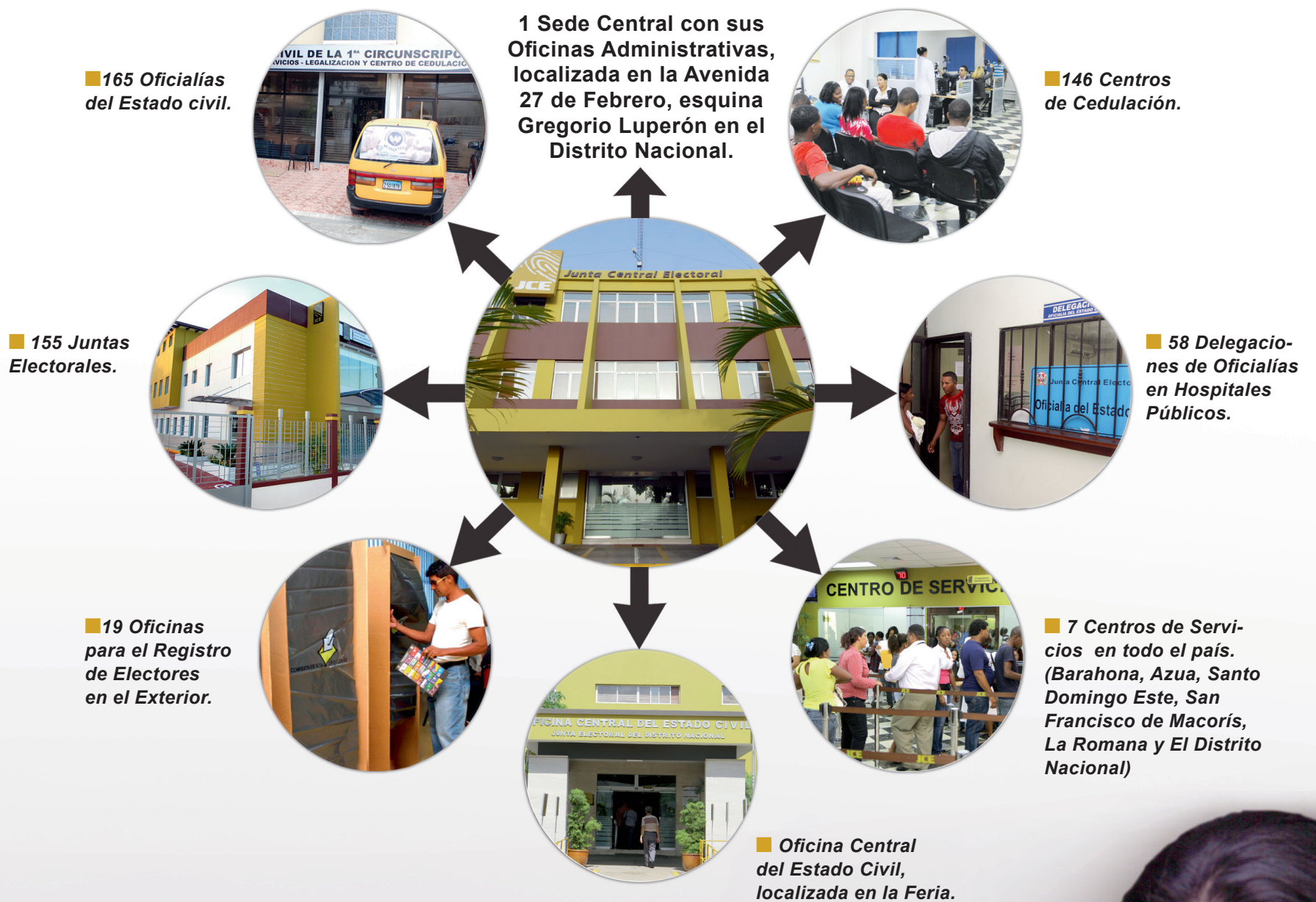
Solicitudes de Servicios de Cedulación y Registro Civil 2011 y 2012