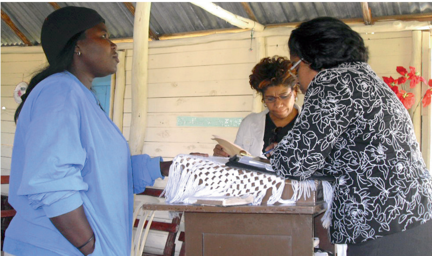
Técnicos de la Unidad de Declaraciones Tardías levantan información en la comunidad de Benerito.