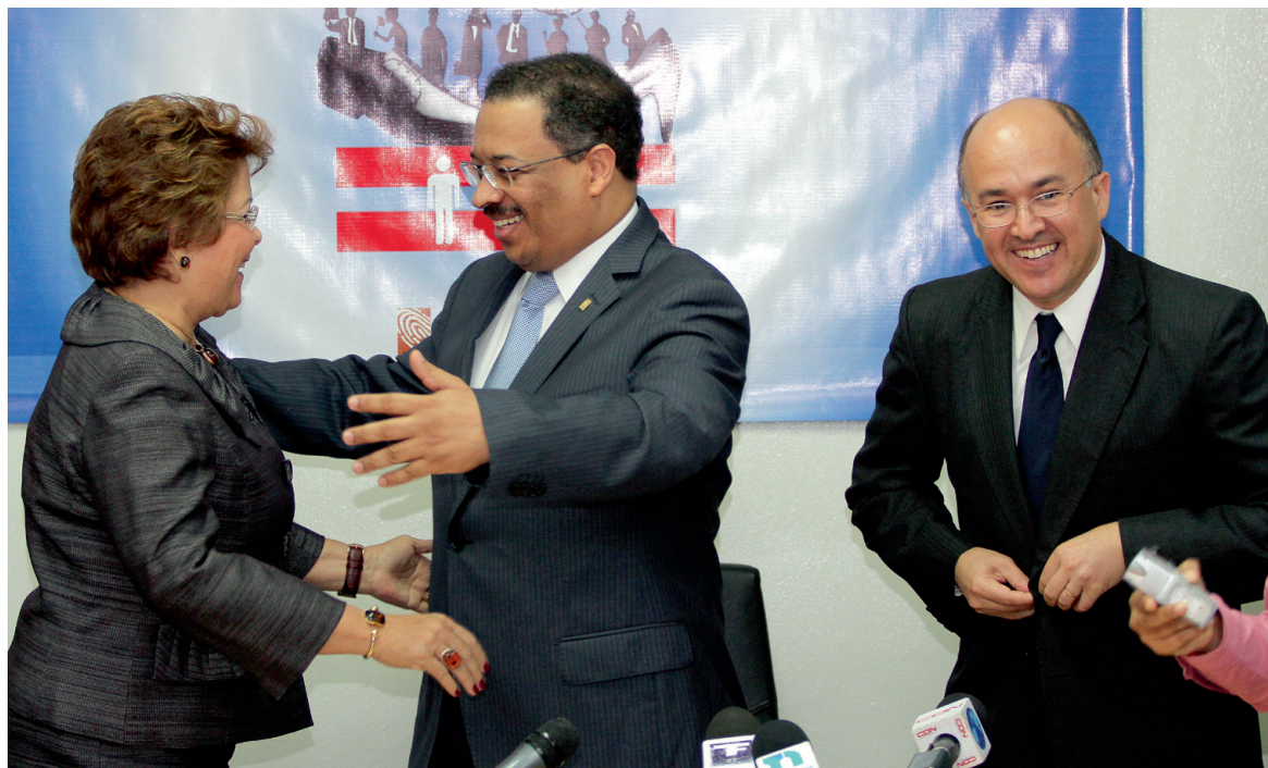
Tras finalizar la firma del convenio los representantes de las tres instituciones se saludaron entusiastamente.

"Felicito a la JCE por esta brillante iniciativa", dijo Domínguez Brito.