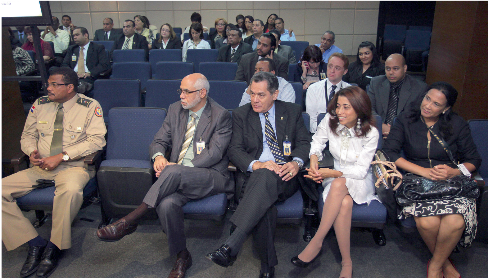
Parte de los funcionarios presentes en el encuentro.

La propuesta entregada al Ministerio de Hacienda asciende a RD$4,549,484,566.00, de los cuales RD$3,839,484,566.00 están destinados a cubrir gastos operacionales y de carga fija de la JCE y sus dependencias a nivel nacional e internacional. La propuesta destina RD$500,000,000.00 para el proceso de renovación y cambio de la Cédula de Identidad y Electoral y RD$210,000,000.00 para la