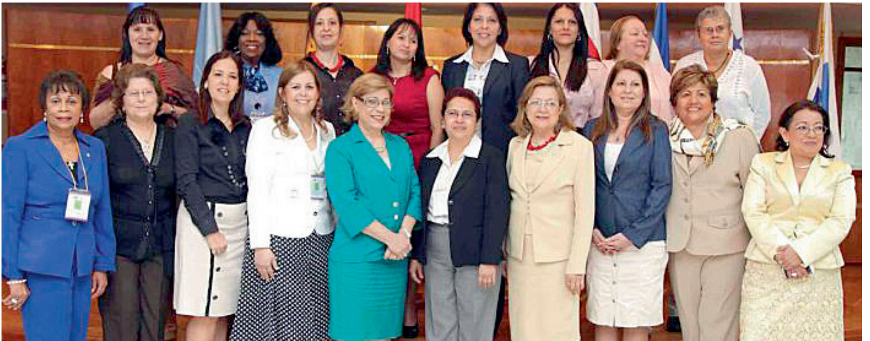
Foto oficial del III Encuentro de Magistradas Electorales de Iberoamérica que se llevó a cabo del 3 al 5 de septiembre en Asunción, Paraguay.