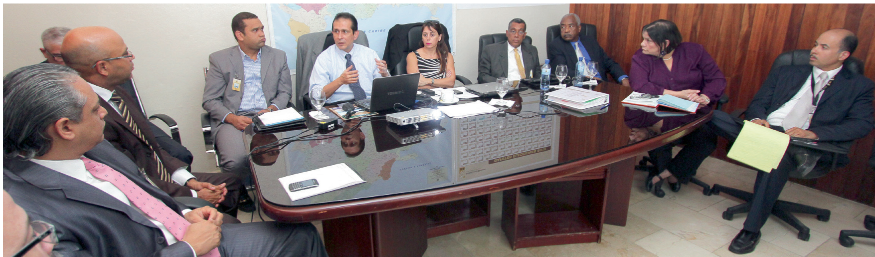
Parte del funcionamiento de la Junta Central Electoral participan en una reunión de Trabajo con los técnicos de la OEA.

A partir de las ventajas que trae consigo la implementación de Sistemas de Gestión de Calidad en el ámbito electoral, surge la idea de impulsar la creación