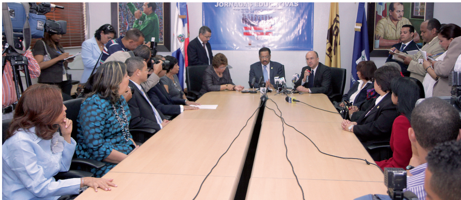
El procurador general de la República, Francisco Domínguez Brito, pondera los alcances del convenio. A su lado el presidente de la Junta Central Electoral, Roberto Rosario Márquez y la Ministra de la Mujer, Alejandrina Germán. Además la foto recoge la presencia de funcionarios de las tres instituciones.

► Se capacitará a empleados sobre la igualdad de género