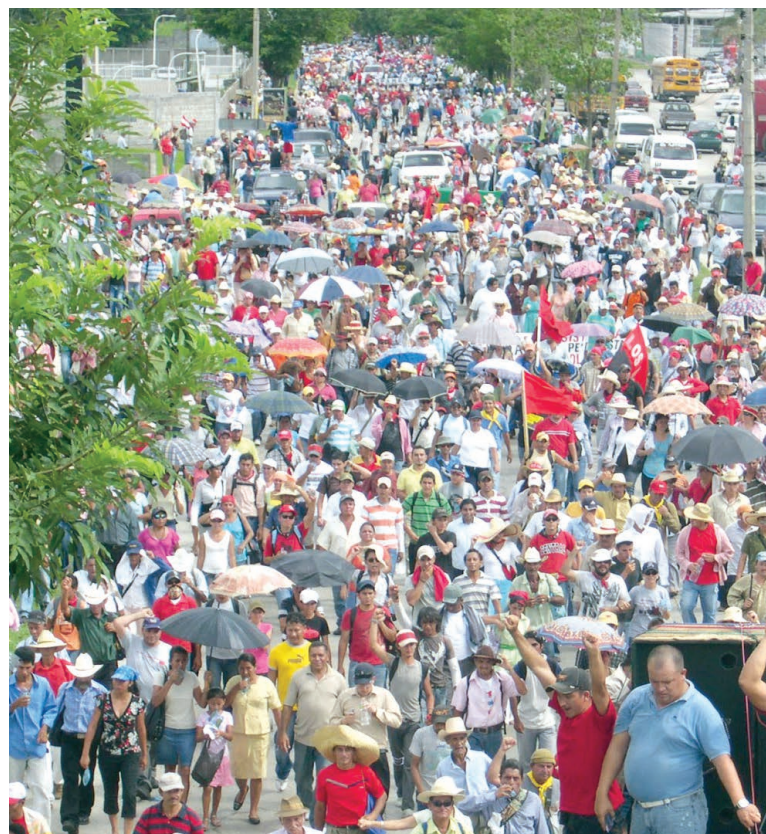
Las elecciones en Honduras se efectuarán en el mes de noviembre.

Por otra parte, el doctor Rosario Márquez, en su condición de Presidente de la Unión Interamericana de Organismos Electorales, UNIORE, informó que esa entidad regional llevara a cabo varias misiones de observación electoral en Honduras, como una forma también de contribuir al éxito del referido proceso electoral. Explicó que la misión de observación de Uniore aprovechará además su presencia en ese país centroamericano para intercambiar con los líderes de los diferentes partidos políticos y de otros sectores de la vida nacional que intervienen en el proceso comicial de noviembre próximo.