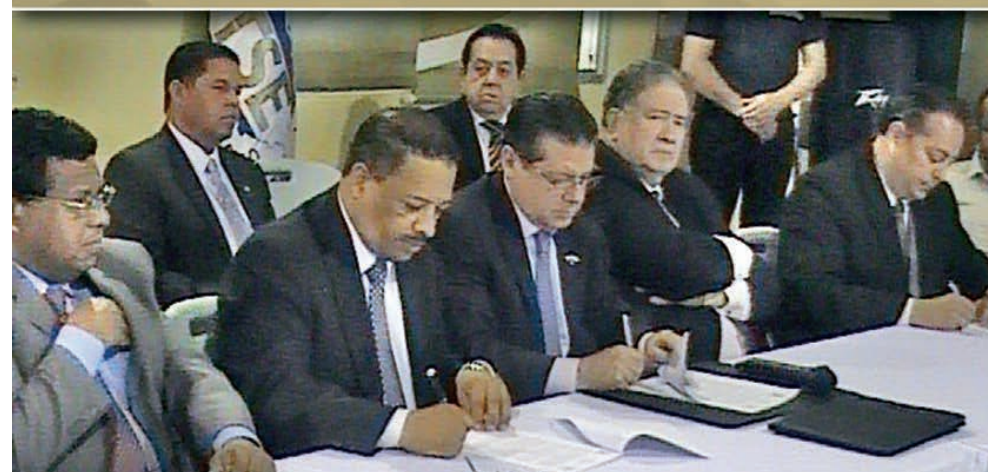
Momento en que las partes firman el documento de cooperación.