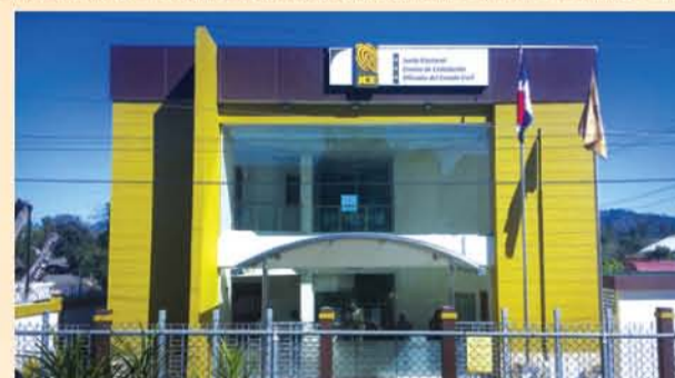
Vista frontal del nuevo edificio donado por el Banco Mundial y el Gabinete de Políticas Sociales que coordina la señora Vicepresidenta, doctora Margarita Cedeño de Fernández.