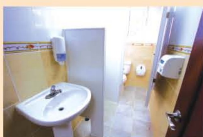
Vista parcial de uno de los baños para el público.