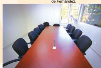
Salón para Delegados de los Partidos Políticos de Restauración.