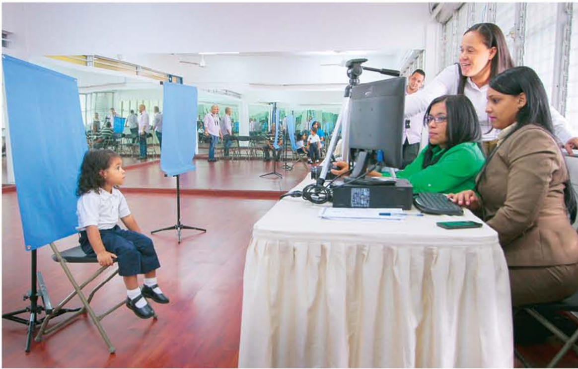
El equipo de la JCE toma la foto a esta niña del Colegio ABC School.