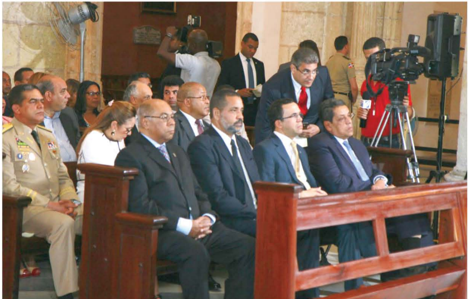
Magistrados, funcionarios gubernamentales y distintas personalidades asistieron a la celebración.