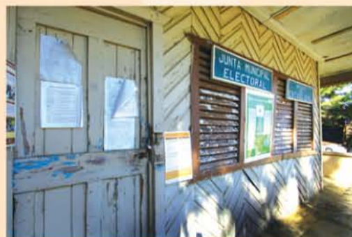
Antiguo local donde funcionaba la Junta Central Electoral en el municipio de Restauración.