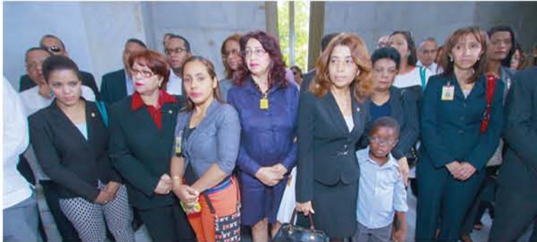
Parte del público que asistió a esta jornada con motivo del 92 aniversario de la JCE.