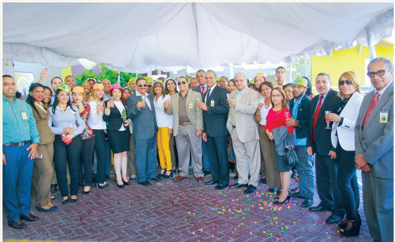
Imagen del Mes

Garantizamos que la parte que nos corresponde como administradores y custodios de la Identidad Nacional, la seguiremos ejerciendo con dignidad y firmeza, sin importar las presiones que sobrevengan.