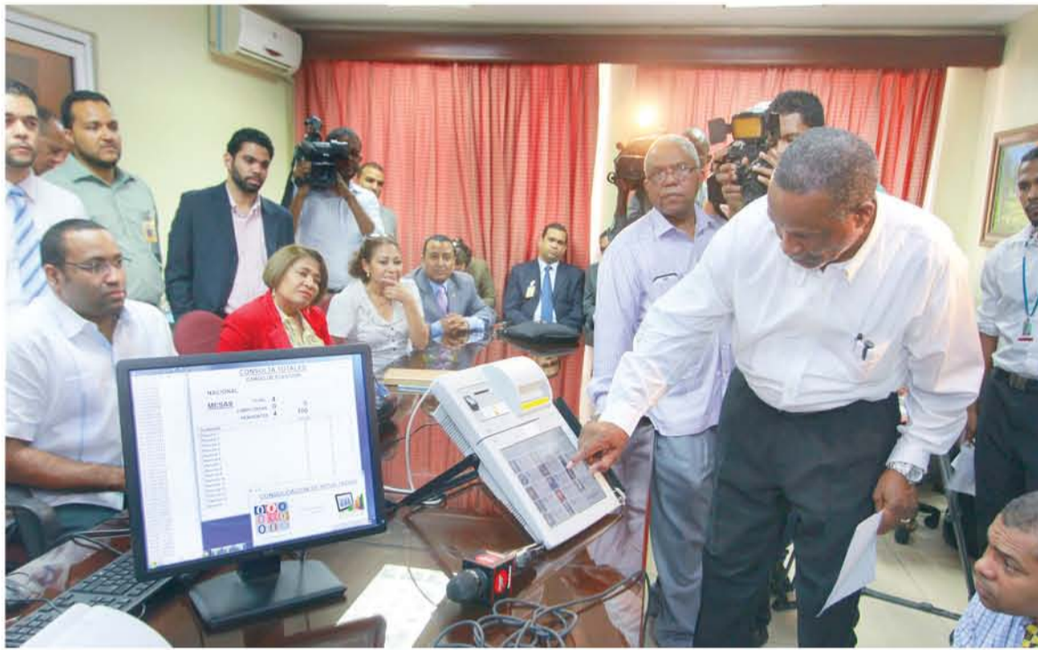
Un dirigente de la ADP demuestra como votará en las elecciones del 14 de octubre.

Asimismo, el Presidente de la ADP, Eduardo Hidalgo agradeció el apoyo de la JCE con miras a que la implementación del voto electrónico por primera vez en el país en las próximas elec-