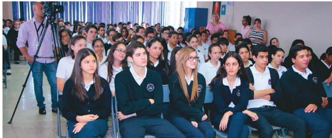
Jóvenes del Colegio ABC School participan en el acto de entrega del carnet estudiantil.