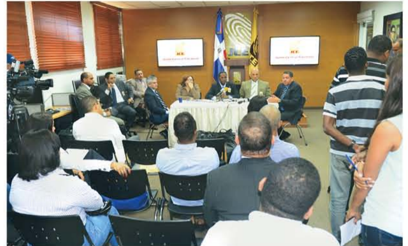
La Comisión de Licitaciones de la JCE encabezó el acto.