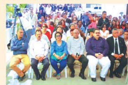
Parte del público asistente al acto inaugural.