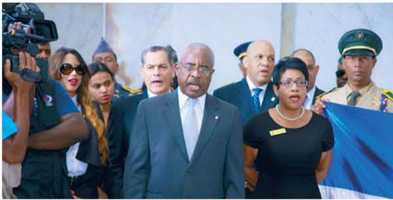
Personal de la JCE entonan el Himno Nacional.