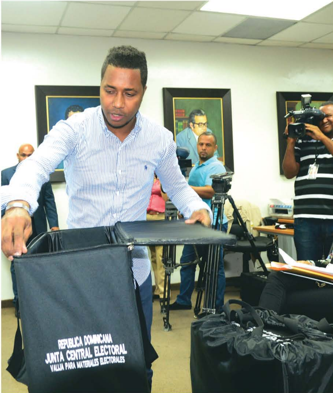
Uno de los ofertantes muestra su propuesta.