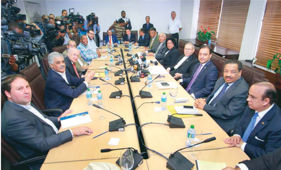
La mesa de conversación estuvo encabezada por Monseñor Agripino Núñez Collado, el Presidente de la Junta Central Electoral, doctor Roberto Rosario Márquez y los Presidentes del Senado de la República, Cristina Lizardo y de la Cámara de Diputados, Abel Martínez.

► La iniciativa ya fue conocida en la Cámara de Diputados