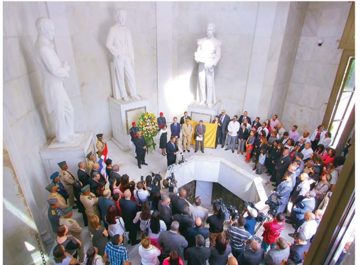
Vista panorámica del acto en el mausoleo.

“Y como si fuera poco, la frecuencia electoral fue afectada por la presencia en nuestro suelo de tropas extranjeras, que respaldaron a dominicanos ambiciosos, aferrados al Poder aunque fuera en la punta del fusil de tropas invasoras. Todo este lapso concluyó con el reinicio de las elecciones de gobernantes por la vía electoral, en el año 1966, en unos procesos catalogados como libres por la comunidad internacional, pero supervisadas por las tropas de ocupación”, exclamó el Magistrado.