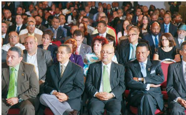
Parte del público que asistió al acto. Entre ellos senadores, diputados, diplomáticos, funcionarios gubernamentales, comunicadores y otras personalidades.

constitucional, sino para todos los llamados “órganos Extrapoder”.