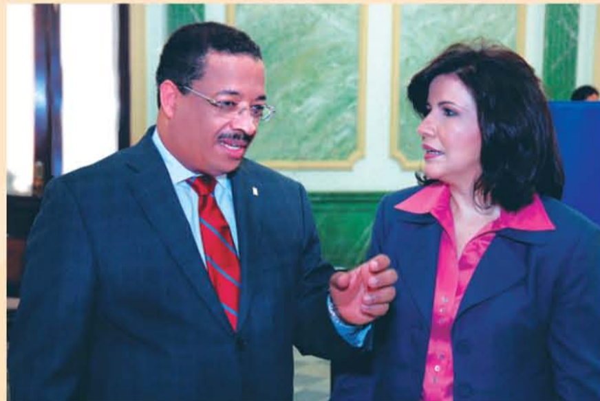
Acuerdo fructífero. - La Vicepresidenta de la República, doctora Margarita Cedeño de Fernández, en su calidad de Coordinadora del Gabinete de Políticas Sociales, concluyó la implementación del acuerdo suscrito por la Junta Central Electoral, mediante el cual se gestionó con el Banco Mundial los recursos necesarios para la construcción de 4 modernos edificios para alojar la Junta Electoral, la Oficialía del Registro Civil y un Centro de Cedulación en igual cantidad de municipios del país, como forma de reforzar los trabajos que realiza la institución para eliminar el subregistro y consolidar los procesos de participación política de las comunidades beneficiadas.

Este es el CUARTO edificio que el Banco Mundial y el Gabinete de Políticas Sociales de la Presidencia de la República, entregan a la Junta Central Electoral para apoyar los trabajos del Registro Civil y de los procesos de participación de la población que administra nuestra institución. Fruto de este acuerdo de colaboración, la JCE había recibido las nuevas edificaciones, con sus equipos y mobiliarios, en los municipios de Villa González, Provincia de Santiago, Jima Abajo, La Vega y Sabana de la Mar, Provincia de Hato Mayor.