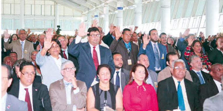
De pies los presidentes, miembros, secretarios y suplentes de las Juntas Electorales hacen su juramento ante el país.

Cuando existe consenso, o coincidencia, respecto a la honorabilidad de un hombre o de una mujer, en el entorno social en el cual desarrolla sus labores, esa persona aporta un valor materialmente incuantificable, que desde el punto de vista moral, contribuye al principal activo de las instituciones que tienen como tarea principal el servicio a la ciudadanía, como