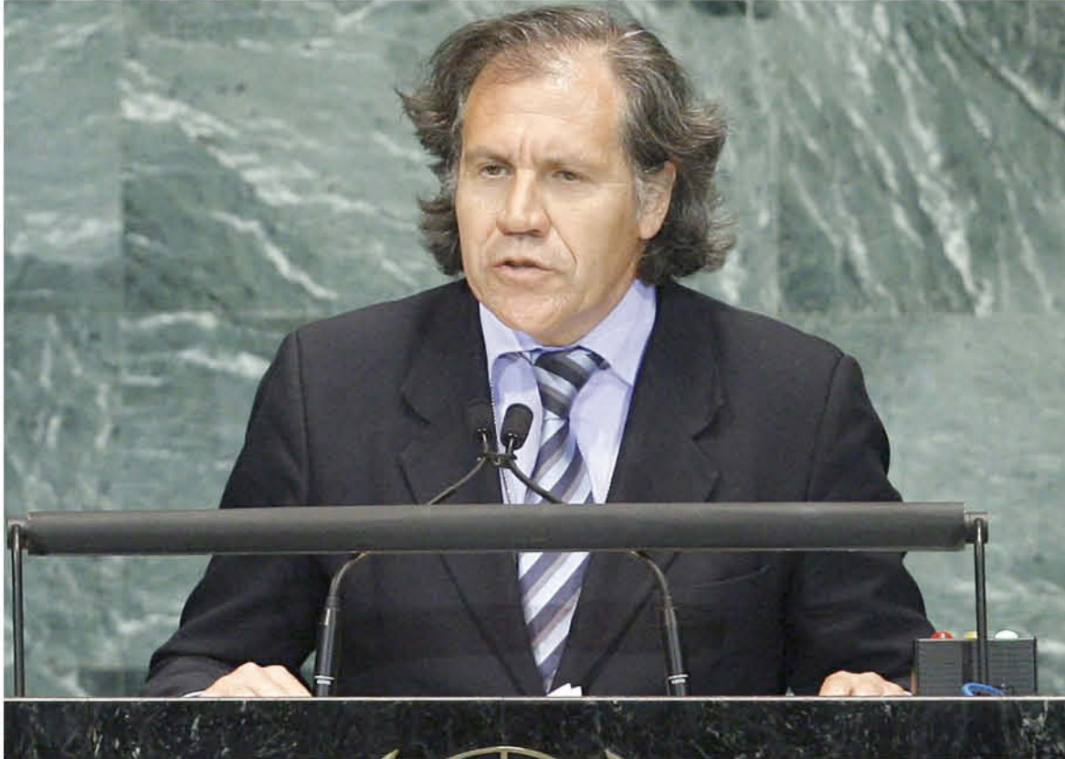
Luis Almagro, secretario general de la OEA

► Secretario de la OEA Luis Almagro y Presidente de JCE firmán acuerdo.