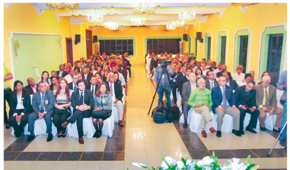
Parte del público que asistió al acto.