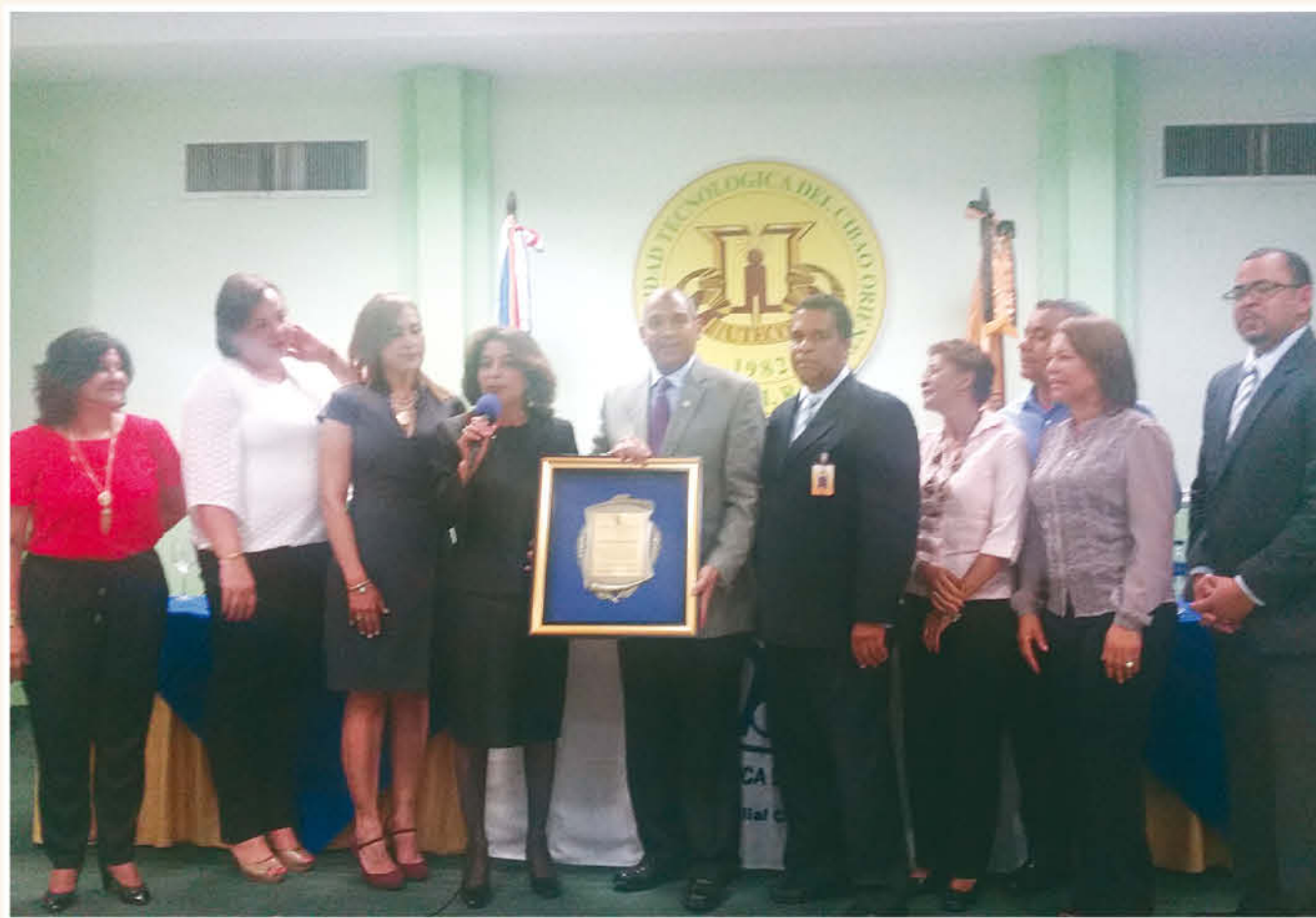
Imagen del Mes

El Pleno, los departamentos que tienen que ver con estas iniciativas y todo nuestro personal estamos al tanto del gran desafío que esto significa, pero estamos convencidos de que el éxito está asegurado.