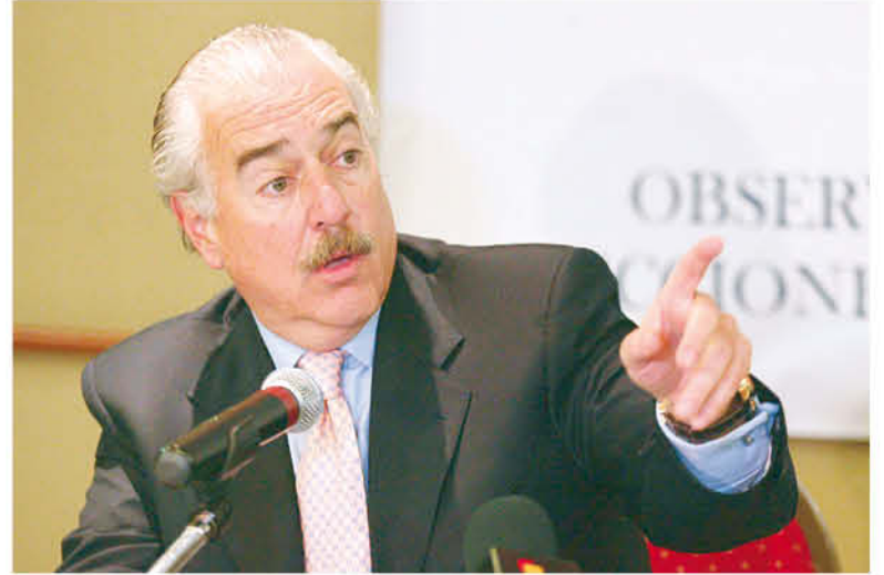
El ex presidente de Colombia, Andrés Pastrana, encabezará la Misión de Observación de la OEA para las elecciones del 15 de mayo.