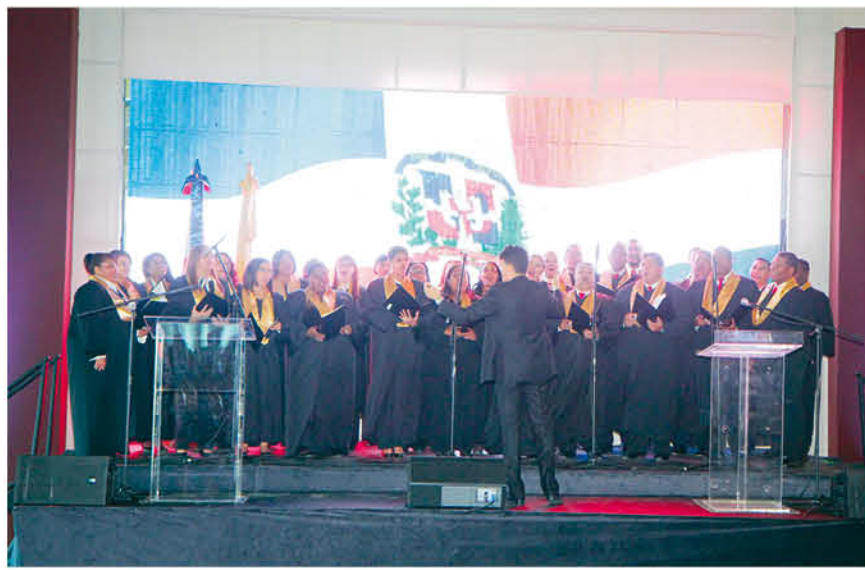
El coro institucional de la JCE entonó las notas del Himno Nacional y deleitó a los presentes con el tema Quisqueya.