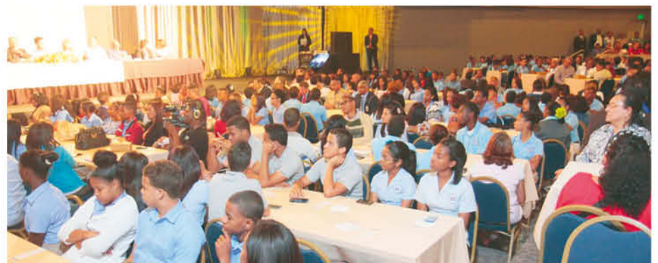
Parte de los jóvenes que llegaron de toda la geografía nacional.