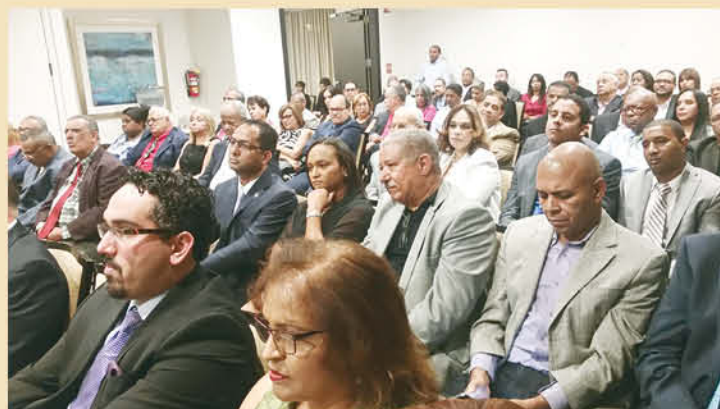
Parte del público que asistió a estas actividades.

“Los votos en el exterior serán sumamente importantes para estas elecciones y en el aspecto cuantitativo ocupa el cuarto lugar en relación a las provincias nacionales, superados solo por Santo Domingo, el Distrito Nacional y Santiago.